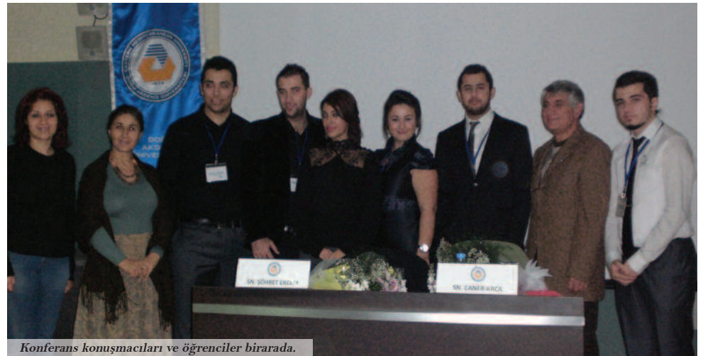
Konferans konuşmacıları ve öğrenciler birarada.