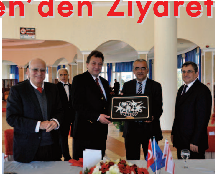
TC Lefkoşa Büyükelçisi Kaya Türkmen DAÜ Yetkilileri ile Birlikte

Öğle yemeği ardından DAÜ yetkilileri ile önce Gazimağusa Kültür ve Kongre Merkezi'ni gezen Büyükelçi Türkmen, daha sonra ise DAÜ kampüsünü ziyaret etti. DAÜ kampüsünün ve alt yapı imkanlarının oldukça etkileyici olduğunu vurgulayan Büyükelçi Türkmen Türkiye Cumhuriyeti'nin DAÜ'nün bir yüksek öğrenim kurumu olarak bölgede gurur kaynağı olduğunun bilincinde olduklarını ve gelişerek büyümeye devam edeceğine olan inancını dile getirdi.