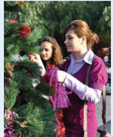
DAÜ girişindeki yeni yıl ağacı öğrenciler tarafından süslendi.