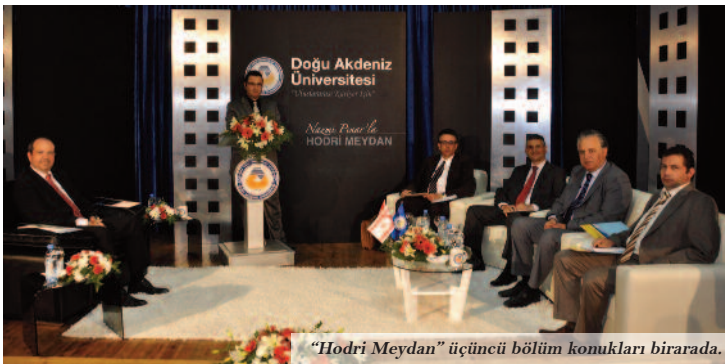
"Hodri Meydan" üçüncü bölüm konukları birarada.

destek vermiyor?" şeklindeki bir soruya yanıt veren KKTC Maliye Bakanı Ersin Tatar, DAÜ'nün KKTC'nin gözbebeği olduğunu ifade ederek, mali sorunlarının büyük bir kısmını aşmış bir eğitim kurumu olduğunu vurguladı. "DAÜ'deki yönetim kararlı tavırları ve özverili çalışmaları ile DAÜ'nün mali sorunlarının çözülmesinde etkili olmuştur. KKTC hükümeti DAÜ'nün her zaman arkasında olacaktır." şeklinde konuşan Maliye Bakanı Tatar, personelin de özveride bulunmaları ile DAÜ'nün artık sorunlu dönemi geride bırakmış ve tekrar atağa geçmiş bir eğitim kurumu olduğunu söyledi.