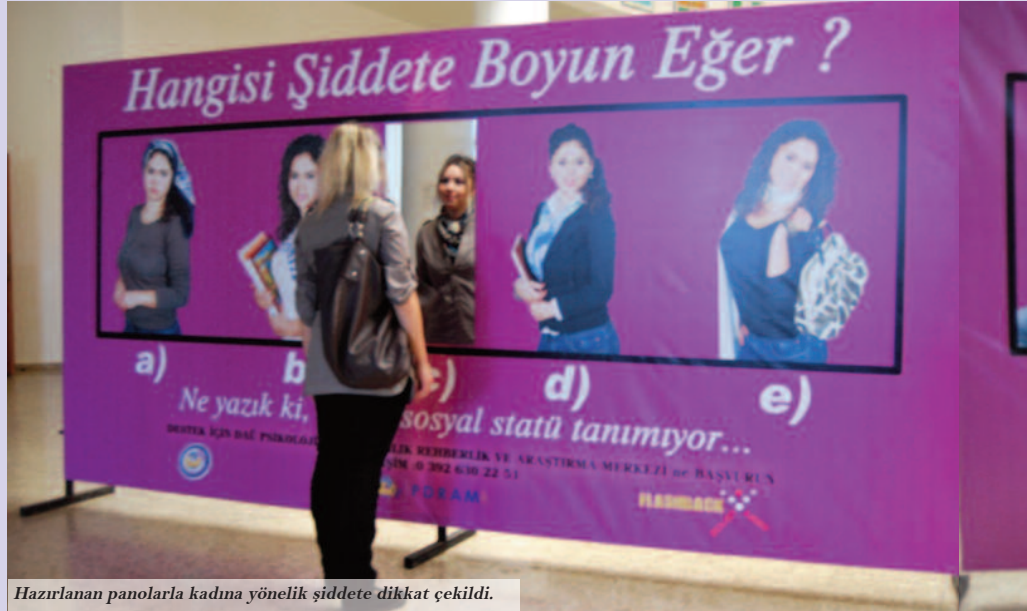
Hazırlanan panolarla kadına yönelik şiddete dikkat çekildi.

sorulduğu, dört farklı sosyal statüden erkeğin resmedildiği diğer panoda da katılımcılardan doğru cevabı bulmaları ve kendileriyle yüzleşmeleri beklendi.