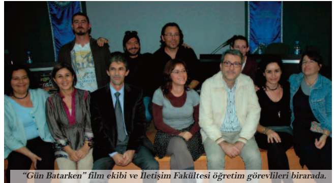
"Gün Batarken" film ekibi ve İletişim Fakültesi öğretim görevlileri birarada.