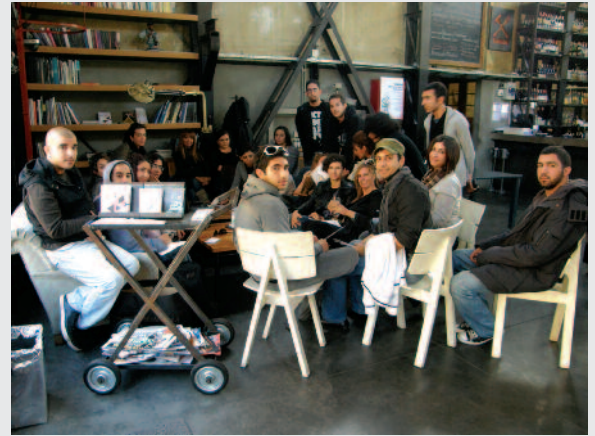
Mimarlık öğrencileri İstanbul'da

sokak, bina ve mekan ölçeğinde teknoloji, sanat, kültürel sürdürülebilirlik, politika gibi kavramlar çerçevesinde analiz çalışmaları yapan öğrenciler, Ayrıca İstanbul 2010 Avrupa Kültür Başkenti kapsamında düzenlenen ve Türkiye'nin değerli bilim adamlarının küratörlüğü ile gerçekleştirilen "İstanbul 1910 - 2010 Kent, Yapılı Çevre ve Mimarlık Kültürü" Sergisinin inceleme olanağı da buldular. Serginin ana yaklaşımının İstanbul'un 100 yıllık kentsel dönüşüm süreci olması, öğrencilere kentsel dönüşüm ve kültürel sürdürülebilirlik temalarını hem İstanbul ölçeğinde hem de genel anlamda sorgulama olanağı sağladı. Öğrenciler için oldukça yararlı geçen gezinin genel anlamda, İstan-