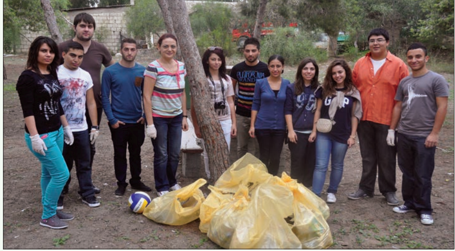
Hazırlık Okulu öğrencileri sosyal sorumluluk projeleri kapsamında Bedis Piknik Alanı'nı da temizlediler

Aynı gün içerisinde, Filistin, İran, Azerbaycan, Kırgızistan, Kazakistan, Fas ve Türkiye'den gelen öğrencilerin oluşturduğu Kıbrıs Kültürünü Tanıma Proje Grubu, Lefkoşa Surlarıçı Bölgesini ziyaret ederek oranın kültürü ile ilgili bilgi sahibi oldular. Arabahmet Bölgesi, Arabahmet Cami, Derviş Paşa Konağı ve Büyükhan öğrencilerin ziyaret et-