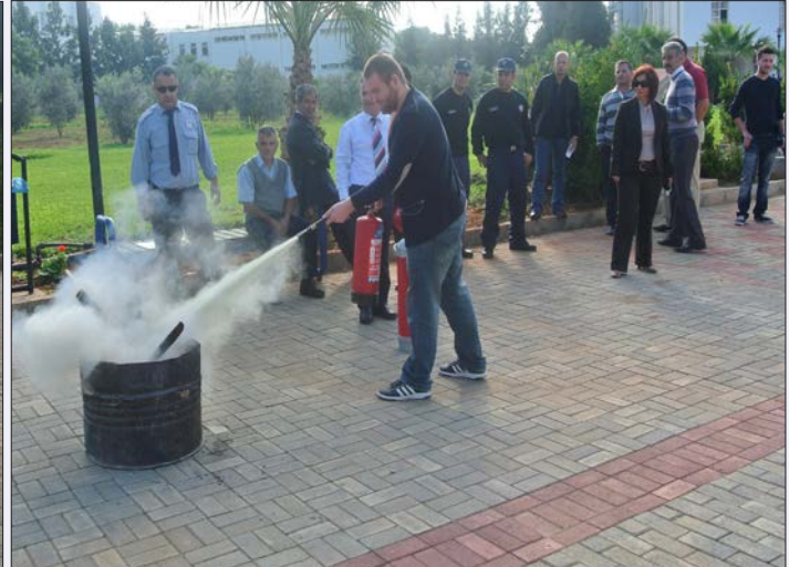
Öğrenciler yangın söndürme cihazını kullanmayı öğrendiler