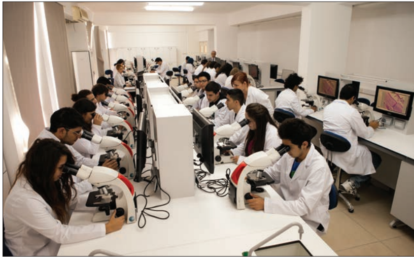
Dr. Fazıl Küçük Tıp Fakültesi

2010 - 2011 Akademik Yılı'nda Sağlık Bilimleri Fakültesi, 2011 - 2012 Akademik Yılı'nda Eczacılık Fakültesi'ni hayata geçiren DAÜ, Uluslararası Ortak Tıp Programı'nın açılmasıyla sağlık alanında önemli bir adım daha atmış oldu.