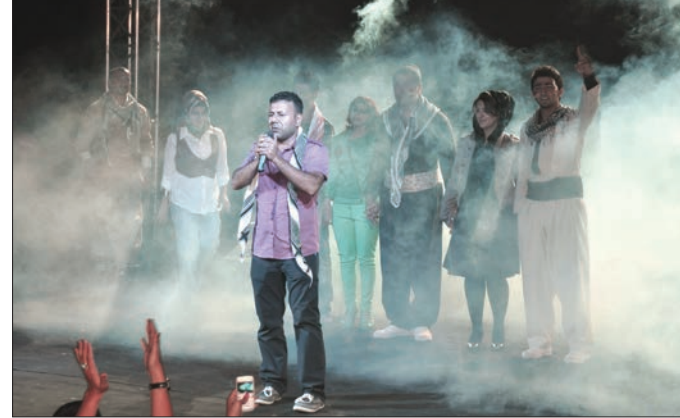
Filistinli öğrencilerin gösterisinden bir kare