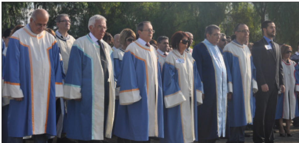
Anma Programı'na kalabalık bir akademisyen ve öğrenci topluluğu katıldı