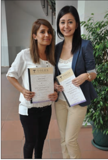
Toles sertifikası alan öğrenciler

Doğu Akdeniz Üniversitesi Yabancı Diller ve İngilizce Hazırlık Okulu ve Hukuk Fakültesi işbirliği ile başlatılan ve DAÜ Sürekli Eğitim Merkezi işbirliği ile düzenlenen Kıbrıs çapında resmi TOLES (Hukuk İngilizcesi Becerileri Sınavları) kurslarını başarı ile tamamlayıp girdikleri uluslararası TOLES sınavında başarılı olan kursiyerlere ve öğrencilere sertifikaları düzenlenen tören ile takdim edildi.