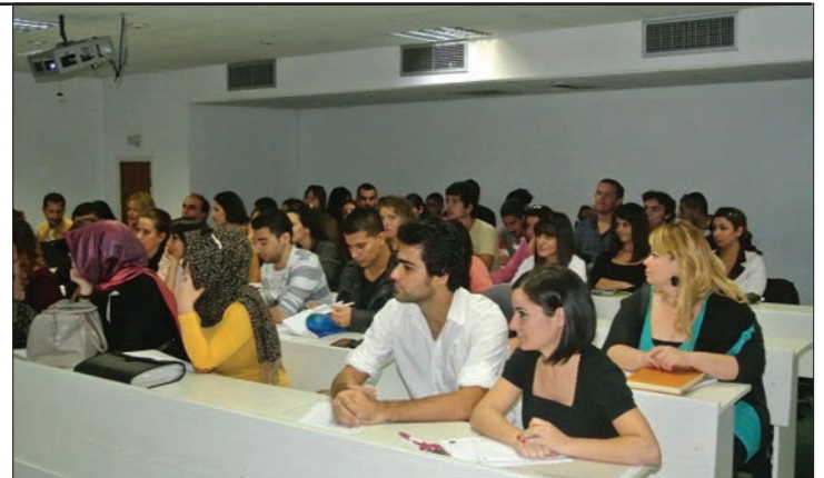
Sunuma İngiliz Dili Eğitimi Bölümü yoğun ilgi gösterdi