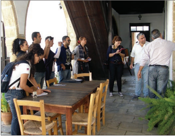
İç Mimarlık Yüksek Lisans öğrencileri Büyük Han'da incelemelerde bulundu

Doğu Akdeniz Üniversitesi (DAÜ) İç Mimarlık Bölümü'nde, 1997 yılından beri İngilizce dilinde eğitim veren lisans eğitimine ek olarak, hem tezli hem de projeli olmak üzere iki Yüksek Lisans programı ve yoğun talep üzerine bir de Türkçe dilinde eğitim veren İç Mimarlık Bölümü, 2010-2011 Güz Dönemi'nden itibaren çağdaş bir eğitim sürdürüyor. Tezli Yüksek Lisans programı çerçevesinde 2012-2013 Güz Dönemi'nde yürütülmekte olan INAR 524 kodlu yüksek lisans dersi kapsamında ülkemizin kanayan yaralarından olan tarihi eserlerin korunması ve yenilenmesine yönelik kavramlar tartışılmakta. Bu nedenle "tarihi binaların koruma ve yenileme konseptleri" (conservation and renovation concepts for historical buildings) isimli bu derste, teorik çalışmaları desteklemek üzere teknik gözlem gezileri yapılıyor.