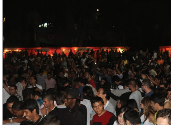
Öğrenciler gösterileri izlerken keyifli saatler geçirdi