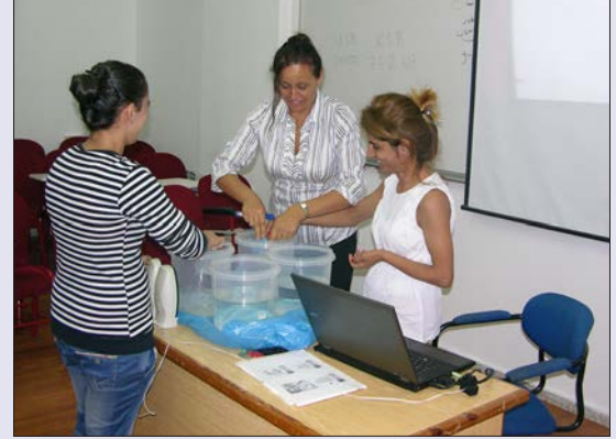
Seminerde ilginç canlandırmalar da yapıldı

gısı nedir, belirtileri nelerdir, sınav kaygısına neden olacak faktörler anlatıldıktan sonra sınav kaygısı ile başa çıkma yöntemleri konularında öğrencilere bilgiler veril-