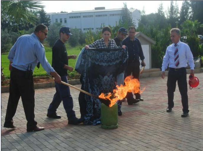
Tatbikatta LPG tüpü yangını söndürme teknikleri gösterildi