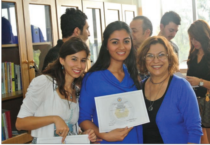
Basarılı öğrenciler şeref ve yüksek şeref sertifikalarını almanın sevincini yaşadılar