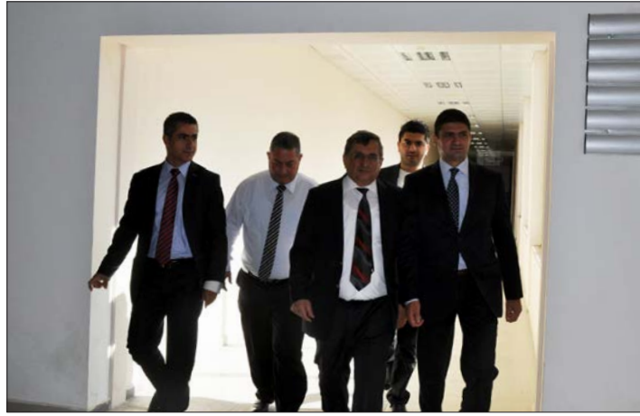
Bakan Sunat Atun yeni binaları yerinde inceledi