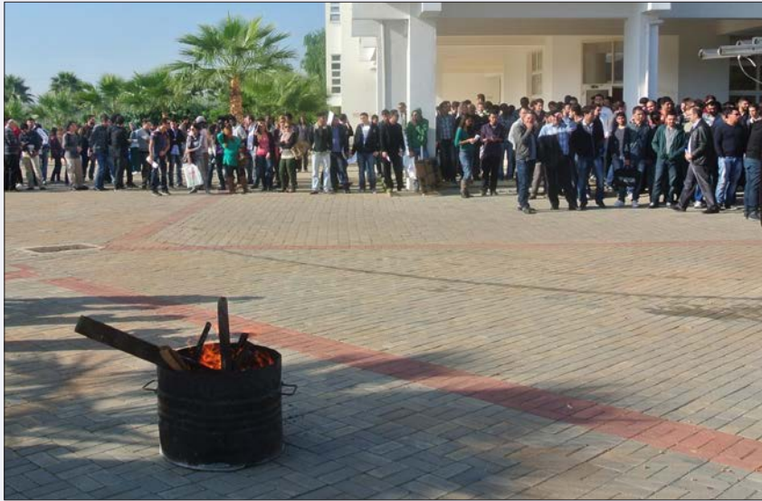
Yangın tatbikatına öğrenciler ve personel yoğun ilgi gösterdi