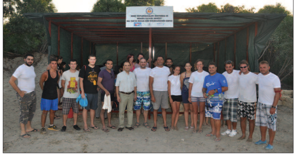
Merkezin açılışına çok sayıda kişi katılarak ilgi gösterdi