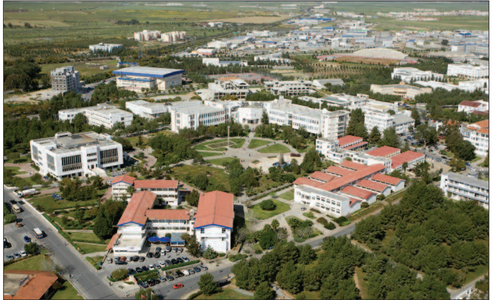
ÖSYS sonuçlarına göre KKTC birincisi olan DAÜ her geçen gün gelişmeye devam ediyor

Türkiye Cumhuriyeti'nde üniversite sayısının 180'e ulaştığı 2012 yılında ÖSYS'de örgün yükseköğretim programlarında bir önceki yıla göre kontenjanlarda %10 artışla toplam 721,925 kontenjana ulaşıldığı ve yerleştirme sonuçları doğrultusunda 80,228 kontenjanın boş kaldığı belirtildi. KKTC üniversitelerine bu yıl 16,485 kontenjanın ayrıldığı ve bu kontenjanlara 5,798 yerleştirme yapılırken, 10,687 kontenjanın ise boş kaldığı vurgulandı. Rektörlük tarafından yapılan açıklamada, DAÜ'ye bu yıl yapılan yerleştirmeler sonucunda bir