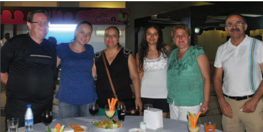
DAÜ Deniz Tesisleri'nde gerçekleştirilen kokteyilde öğrenciler ve velileri DAÜ yönetimi ile tanışma fırsatı buldu

Gecede Sosyal ve Kültürel Aktiviteler Müdürlüğü'ne bağlı kulüpler stand açarak Üniversiteye yeni kayıt yaptıran öğrencilerin kulüplerini tanıttılar. Çok sayıda yeni öğrencinin kulüplere üye olmak istemesi, kulüp başkanlarını oldukça memnun etti. Kulüp standlarının yanı sıra fakülte ve bölümler de stand açarak tanıtım yaptılar. Gecede öğrencilere Kıbrıs yemek kültürünü yansıtan çörek