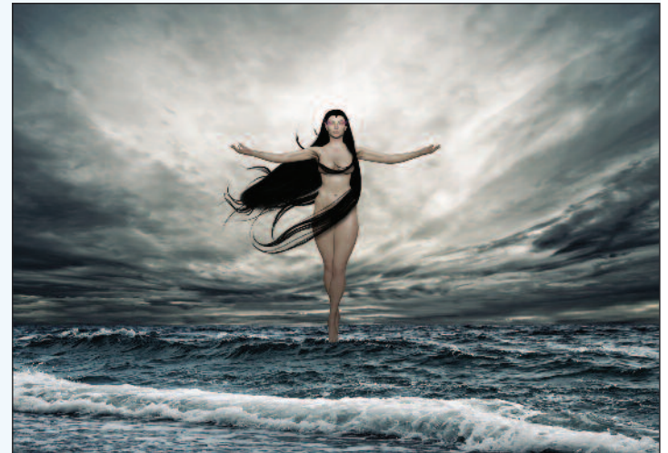
DAÜ'lü öğrencilerin çalışmaları beğeniye sunulacak