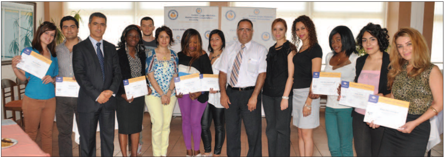
LCCI Turizm İngilizcesi Sınavı'na katılanlar sertifikalarını aldılar

lararası iş dünyasına giriş vizesi ve başarı anahtarı olarak kabul edilmektedir. DAÜ tarafından verilen kurslarda alanında uzman eğitimciler Turizm ve İşletme İngilizcesi öğretmek için LCCI tarafından da eğitilmişlerdir. Ekim ayında başlayan yeni dönem kurslara katılmak isteyenler DAÜ Sürekli Eğitim Merkezi'nden veya 630 2471 numaralı telefondan detaylı bilgi alabilirler.