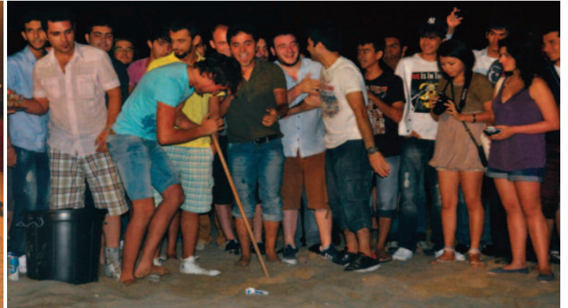
Atatürk Meydanı'nda gerçekleştirilen "Hoşgeldiniz Gecesi" renkli görüntülere sahne oldu.