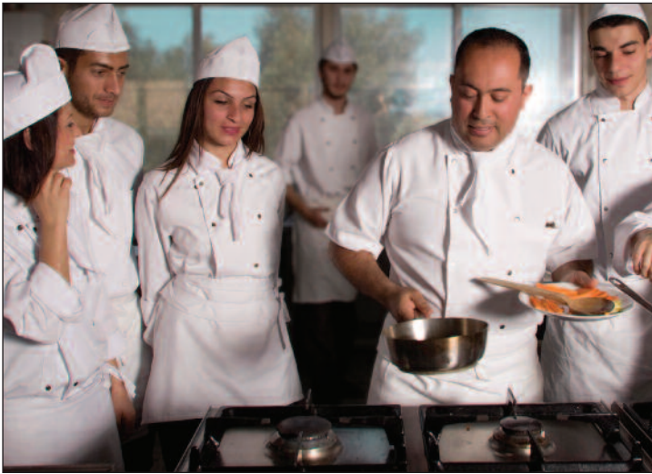
Aşçılık Önlisans Programı profesyonel aşçılar yetiştiriyor

Doğu Akdeniz Üniversitesi (DAÜ) Turizm Fakültesi Turizm İşletmeciliği Doktora Programı Türkiye Cumhuriyeti Yükseköğretim Kurulu'ndan onay aldı. Bilimsel araştırmalarda ve yayınlarda Doğu Akdeniz'de bir numara ve Avrupa'nın en iyi üçüncü fakültesi konumunda bulunan DAÜ Turizm Fakültesi, onaylanan Doktora Programı ile eğitim kalitesini her geçen gün yükseltmeye devam ediyor. Fakülte Dekanlığı, 2000-2009 tarihleri arasında turizm ve otel işletmeciliğine yönelik yayımlanmış makale sayısına göre dünya