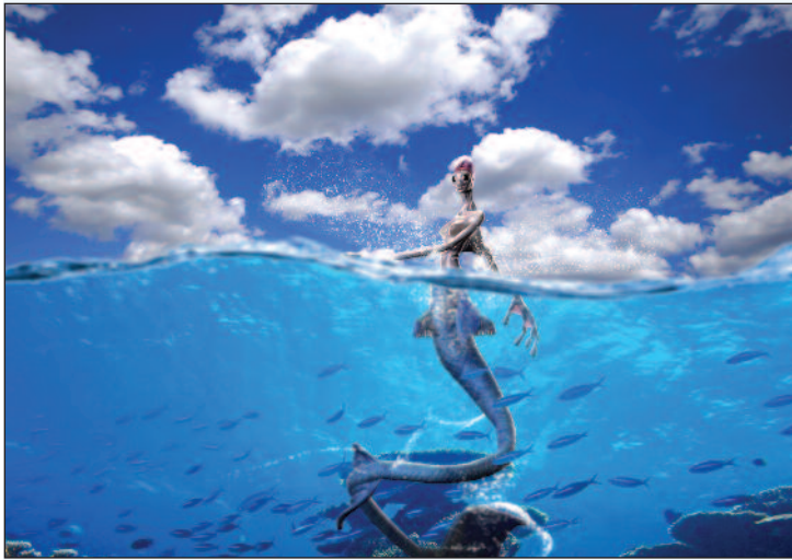
Bölüm öğrencilerinin çalışmaları bienalde yer alacak.

D oğu Akdeniz Üniversitesi (DAÜ) ile Bilgi Üniversitesi İletişim Fakültelerinin Görsel İletişim Tasarım Bölümleri, İstanbul Tasarım Bienali'ne ortak sergiyle katılıyor. Bölümler sergide, Dijital Sanat ve Video Art niteliğindeki çalışmalarla yer alacaklar. 13 Ekim - 12 Aralık 2012 tarihleri arasında İstanbul'da gerçekleşecek bienale DAÜ dışında Türkiye'den 25 üniversitenin tasarımıyla ilgili 76 bölümü kabul edildi.