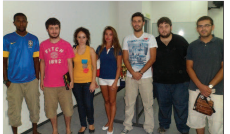
Projeye katılan öğrenciler birarada

sorumluluk anlayışı içinde hareket ettiklerini ve çocuklarla ailelerin, toplantıya gösterdikleri yoğun ilgiden mutluluk duyduklarını ifade ettiler. Etkinlik için destek olan MULTIMAX'a ve MAGEM'e de teşekkür eden öğrenciler, bilinçli internet kullanımını anlatmaya devam edeceklerini belirttiler.