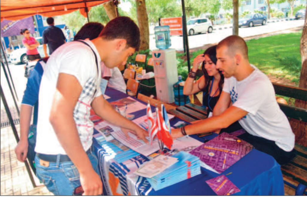
Yeni gelen öğrencilere kurulan standlarda bilgi verildi

Doğu Akdeniz Üniversitesi (DAÜ) Sosyal ve Kültürel Aktiviteler Müdürlüğü tarafından organize edilen 15. Oryantasyon Günleri kapsamında yeni öğrenci ve velileri için birçok aktivite gerçekleştirildi.