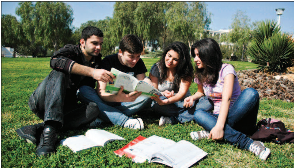
Üniversiteye kayıt yapan yeni öğrenciler huzurlu ortamda eğitim alıyor.

DAÜ, DGS sonrası ortaya çıkan tablo da dikkate alındığında öğrenciler tarafından tercih edilen üniversite olduğunu bir kez daha ortaya koymuştur. Bu da üniversitenin eğitim kalitesi, akreditasyonlar ve uluslararasılaşmaya yapmış olduğu yatırımların bir sonucu olarak değerlendiriliyor.