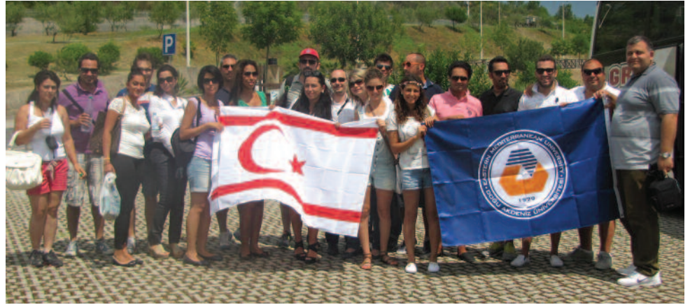
DAÜ - GİMER öğrenciler için bilgilendirici geziler de düzenliyor