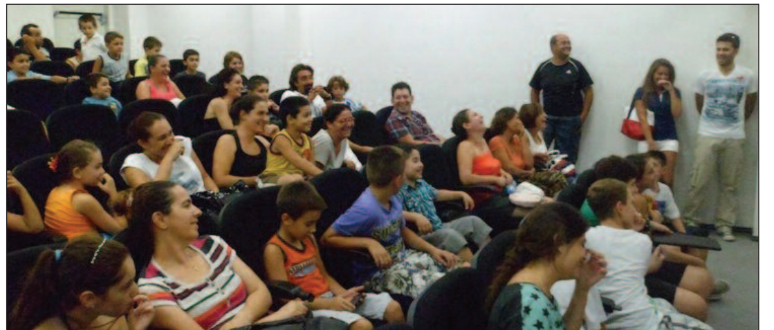
Bilgilendirme toplantısına yoğun katılım oldu