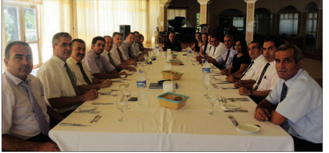
Uluslararası Üniversiteler Arama Kurtarma Konseyi Temsilcileri DAÜ Deniz Tesisleri'nde toplandı