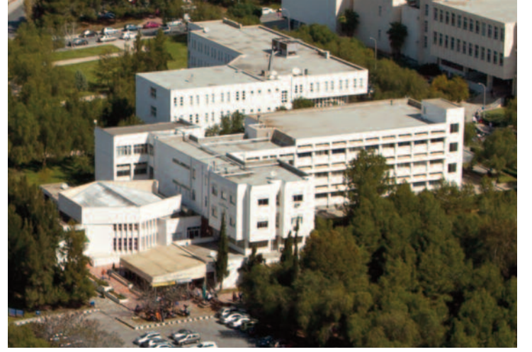
İşletme ve Ekonomi Fakültesi dünya sıralamasındaki yükselişi ile dikkat çekiyor

"Webometrics", merkezi İspanya'da bulunan ve İspanya'nın en büyük kamu araştırma kuruluşu olan Milli Araştırma Konseyi (CSIC) bünyesinde faaliyet gösteren merkez tarafından yürütülen ve dünyada faaliyet gösteren 20 binin üzerinde üniversite üzerinde yapılan çalışmalardan yola çıkılarak hazırlanan listeleri kapsıyor.