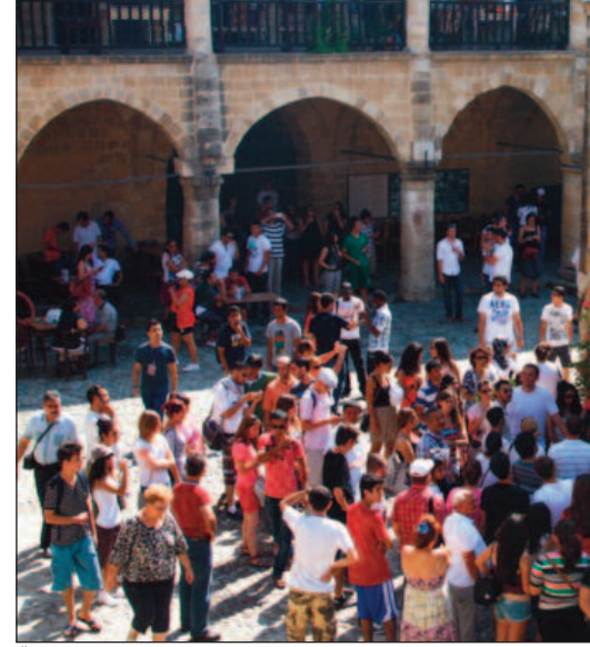
Öğrenciler ve velileri Büyük Han'da

Doğu Akdeniz Üniversitesi (DAÜ) Öğrenci Hizmetleri ile Sosyal ve Kültürel İşler'den Sorumlu Rektör Yardımcılığı'na bağlı Sosyal ve Kültürel Aktiviteler Müdürlüğü tarafından 15. Oryantasyon Günleri kapsamında, 21 Eylül 2012 Cuma akşamı saat 19:30'da Atatürk Meydanı'nda (CL Meydanı)