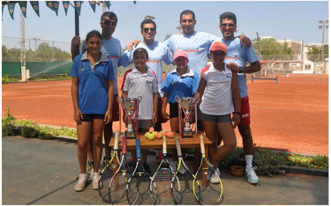
Tenis antrenörlerimiz ve tenisçilerimiz birarada