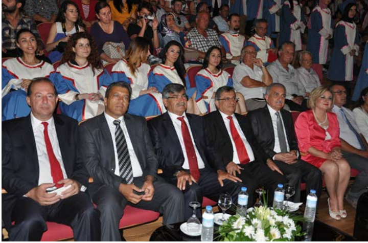
Törene protokolden yoğun bir katılım oldu

Törende konuşmaların ardından Fizyoterapi ve Rehabilitasyon Bölümü, Beslenme ve Diyetetik Bölümü, Hemşirelik Bölümü, Sağlık Yönetimi Bölümü, İlk ve Acil Yardım Bölümü ile Anestezi Bölümlerinden mezun olacak olan öğrenciler bölüm başkanları eşliğinde kendi bölümlerine özgü olan yeminlerini okudular. Törende ayrıca Eğitim Fakültesi, Güzel Sanatlar Eğitimi Bölümü Müzik Öğretmenliği Programı öğrencileri müzik dinletisi de gerçekleştirdi.