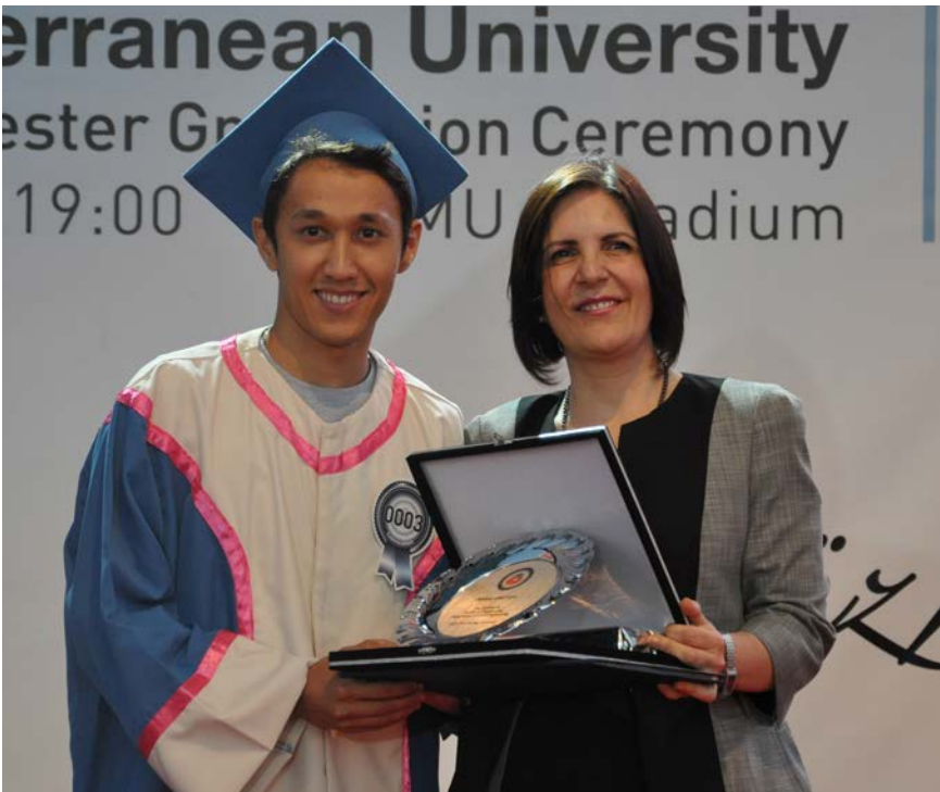
KKTC Meclis Başkanı Dr. Sibel Siber fakülte birincisi mezunumuza ödülünü takdim ederken