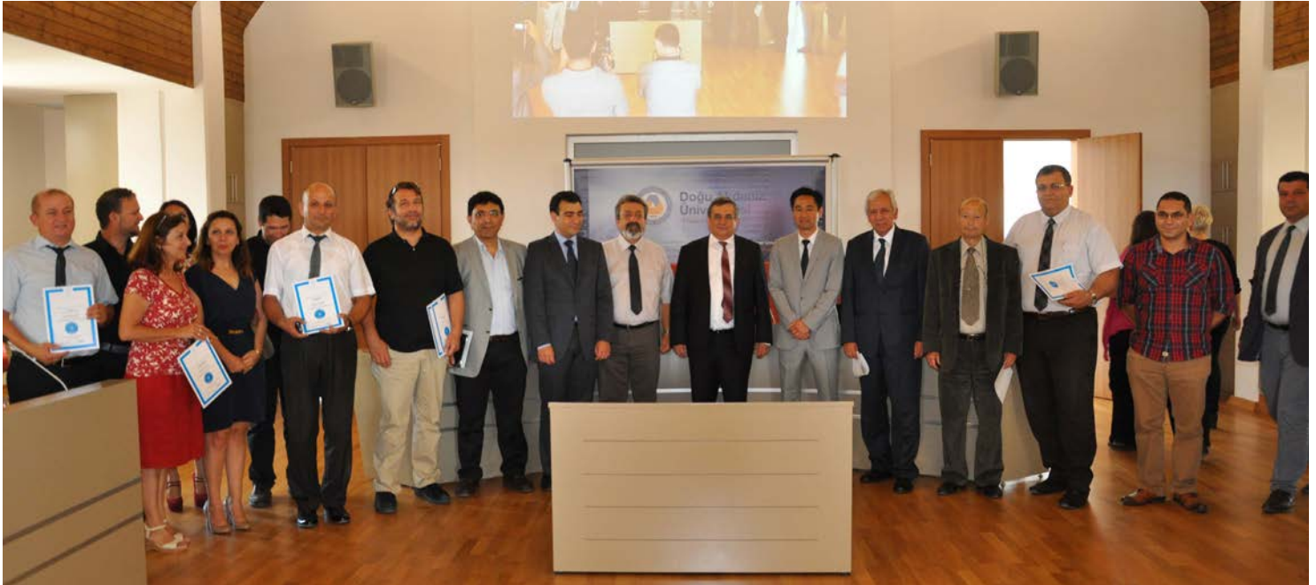
FIBAA sertifikası almaya hak kazanan akademik birim temsilcileri birarada