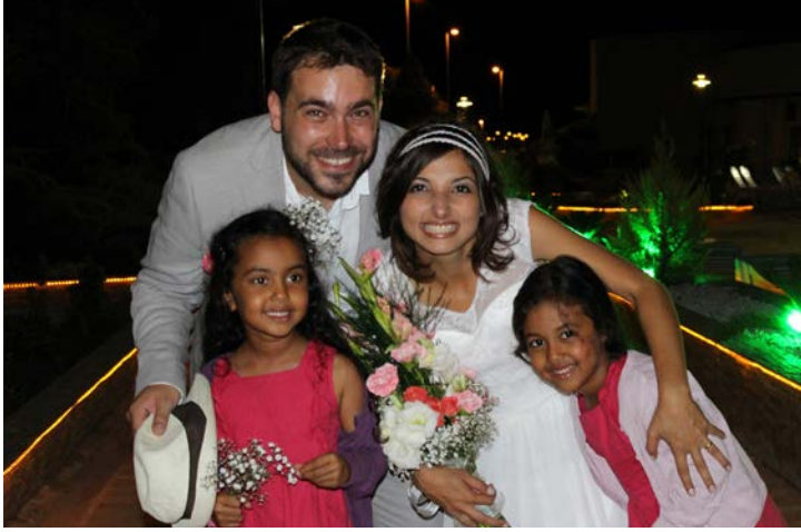
Genç çift DAÜ Deniz Tesisleri'ndeki düğünde oldukça mutluydular

gerçekleştirilen düğünde DAÜ, farklı kültürleri aynı sevinçli paylaşma çatısı altında toplayarak Kuzey Kıbrıs'ın doğal güzellikleriyle bezenmiş sahlinde ne denli güzel bir atmosfer yaratılabileceğini bir kere daha kanıtladı.