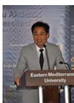
FIBAA Akreditasyon Belgeleri Düzenlenen Tören ile Takdim Edildi