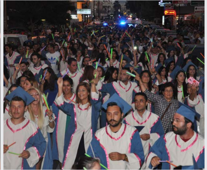
Mezunlar Mezuniyet Yürüyüşü’nde coşku dolu anlar yaşadılar