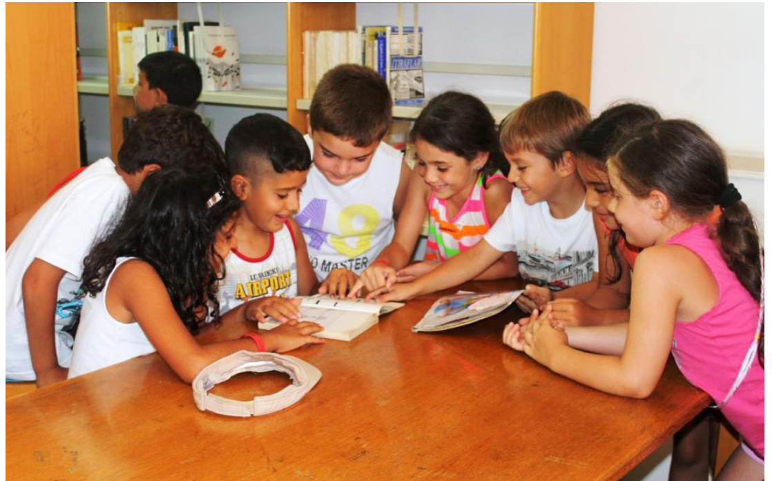
Çocuklar yapılan etkinliklerde hem eğlendiler hem de öğrendiler