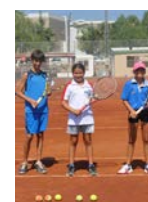
DAÜ Spor Alanındaki Başarıları İle Fark Yaratıyor