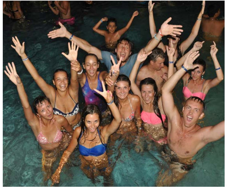
Yaz Okulu katılımcıları kurslar dışında denizin ve eğlencenin tadını da çıkarttılar