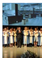
Yeni Sağlıkçılar Yemin Etti