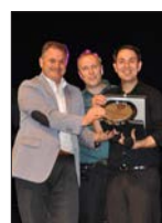
DAÜ, Uluslararası Korolar Festivali'ne Ev Sahipliği Yaptı