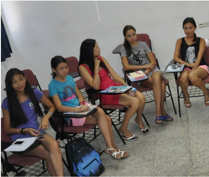
DAÜ Yaz Okulu'na katılanlar yararlı kurslar aldılar

Yaz Okulu kapsamında DAÜ'ye gelen öğrenciler gerek DAÜ'nün akademik kalitesine gerekse kampüs olanaklarına hayran kaldıklarını belirttiler. Tüm yaz okulu kursları Pearson Edexcel tarafından uluslararası denkliğe sahip olup, kursu başarı ile tamamlayan öğrencilere kurs sonunda Edexcel belgesi de takdim edildi.