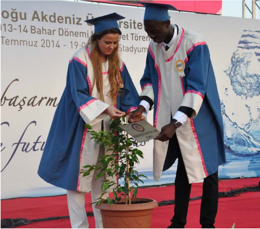
Mezunlarımız sembolik ağaç dikme töreninde