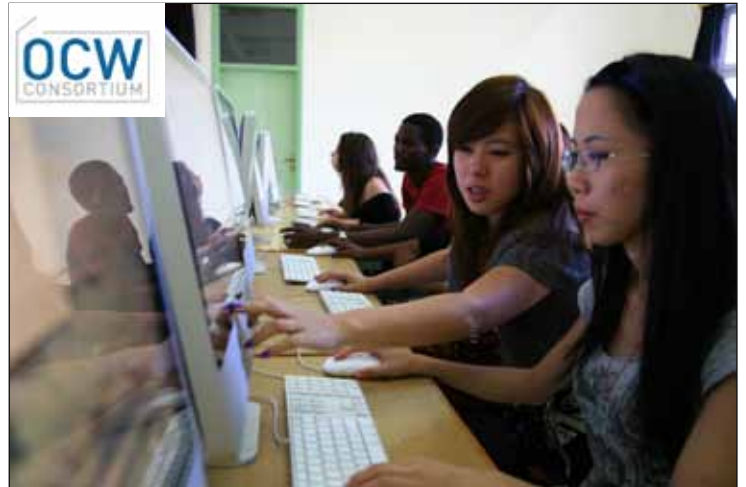
DAÜ'ye ait dersleri öğrenciler http://ocw.emu.edu.tr adresinden takip edebilecekler

2009 yılında, kendi özgün derslerini İnternet ortamında açık olarak yayınlayan girişimci öğretim üyelerinin bu derslerin aynı ortamda bütünleştirilmesi ile açık ders projesini başlatmıştır. http://opencourses.emu.edu.tr adresinde yayınlanan derslere, çok kısa bir süre içeri-