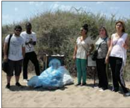
İletişim öğrencileri birçok atık topladılar

Doğu Akdeniz Üniversitesi (DAÜ) İletişim Fakültesi, Halkla İlişkiler ve Reklamcılık Bölümü son sınıf öğrencileri, Gazimağusa'nın en güzel plajlarından birisi olan Bedi's plajını temizlediler. 5-11 Haziran tarihleri arasında kutlanan Dünya Çevre Haftası kapsamında gerçekleştirilen etkinlikte, plajın güzelliğini bozan atıklar toplandı ve çöpe atıldı. Çevreyi temiz, yaşanılır bir hale getirmek amacıyla taşıyan bu etkinliği gerçekleştiren öğrenciler, yaklaşık