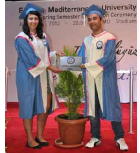
Bahar Dönemi mezunlarımız adına sembolik ağaç dikme töreni gerçekleştirildi