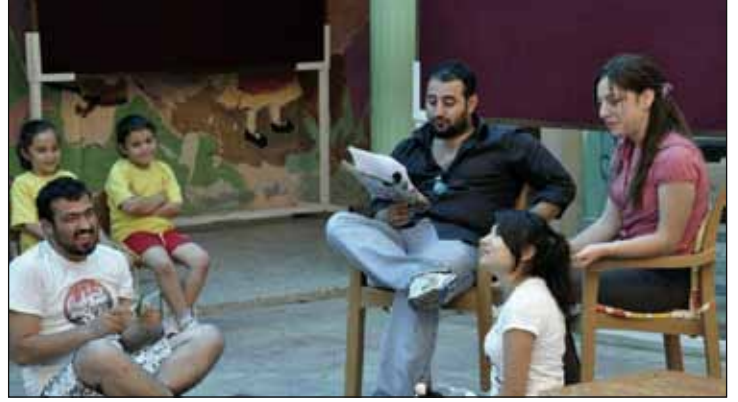
İletişim öğrencileri ilkokulda renkli ve eğretici bir etkinliğe imza attı