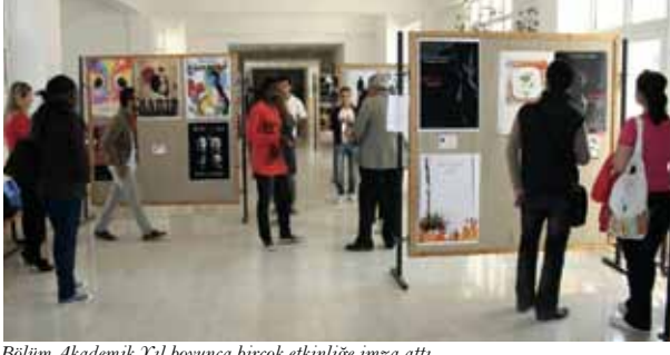
Bölüm Akademik Yılı boyunca birçok etkinliğe imza attı

Bölüm geçen yıl, Uluslararası Grafik Tasarım Konseyi (ICOGRADA) gibi oldukça önemli ve prestijli bir uluslararası kuruluşa üye oldu. Kıbrıs Rum üniversitelerinin üyeliğe yaptığı itirazlar kabul görmedi. Uluslararası