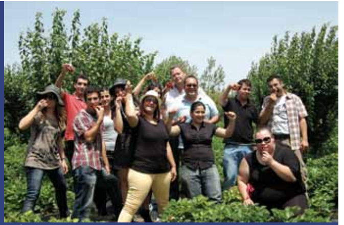
DAÜ'lü aşçılar organik tarım ve beslenme hakkında bilgi aldılar

Gençler çiftlikte bulunan restorantta taze, lezzetli ve yöresel yemekleri tadıp, ardından da çiftliği gezip organik tarımla yetiştirilen birçok meyve ve sebze dalından koparıp tadma bakma imkanı elde ettiler. Gençler gün boyunca tesis yöneticisinden organik doğal yaşam, meyve sebze ve menülerle ilgili bilgi aldılar ve ayrılırken de mezuniyet sonrası organik ürünlerle pişirilecek özgün, kaliteli ve lezzetli yemeklere imza atacaklarını ve en iyi şekilde topluma hizmet edeceklerini belirttiler.