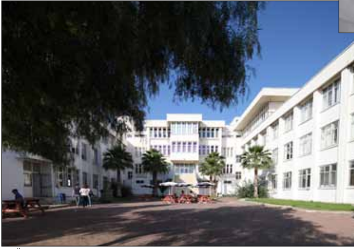
DAÜ Fen ve Edebiyat Fakültesi