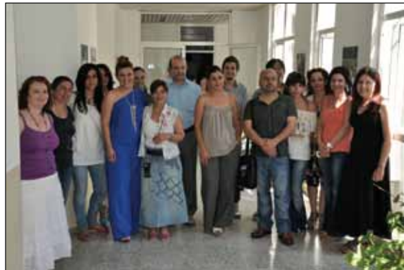
Sergiye katılan öğrencilerin mutluluğu yüzlerinden okunuyordu

Hazırlık Okulu binasında yer alan sergi Büyükkonuk, Çınarlı, St. Barnabas, Salamis Harabeleri ve Kantara Kalesi'nden çeşitli kompozisyonlar barındırıyor.