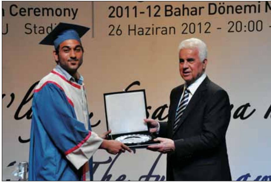
KKTC Cumhurbaşkanı Dr. Derviş Eroğlu Fakülte birincisi öğrencimize diploma ve ödülünü takdim etti