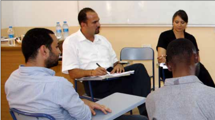
Jüri öğrencileri terletti

Doğu Akdeniz Üniversitesi (DAÜ) İletişim Fakültesi, Gazetecilik Bölümü öğrencileri mezuniyet projelerini savunmak için jüri karşısına çıktı.