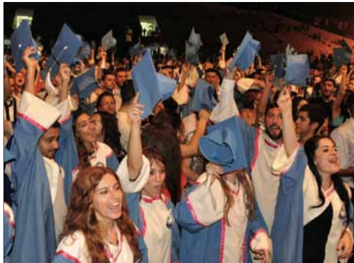
DAÜ 1700 mezun daha vermanin gururunu yaşadı