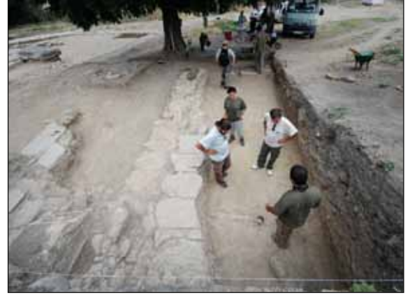
DAÜ - SAGAM Türkiye'de de kazı alanında başarılı çalışmalarına imza atıyor

DAÜ, deniz biyolojisi, su altı arkeolojisi ve su altı görüntüleme alanlarında dünyada ilk beş üniversite arasında gösteriliyor.