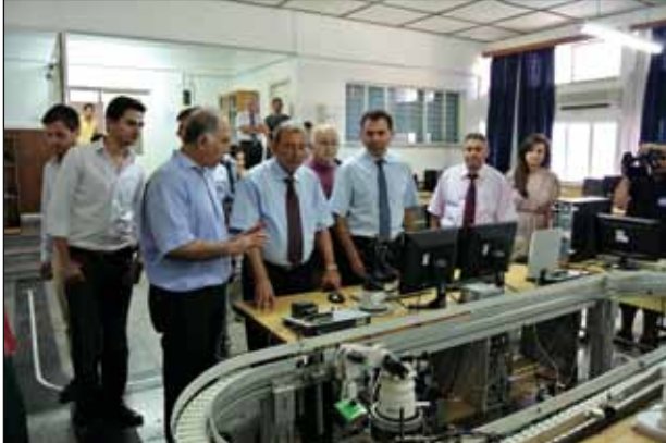
Sanayi Odası ve Fakülte yetkilileri projeleri incelerken