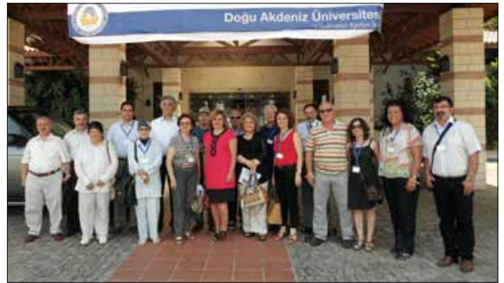
Konseyde gerçekleştirilen panellerde Sağlık Bilimleri ele alındı

Toplantının 2. gününde de yapılan oylamalar sonucunda dekanlardan oluşan 5 kişilik bir yürütme kurulu belirlendi. Yürütme Kurulu Başkanlığına İstanbul Üniversitesi