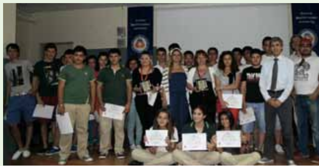
Öğrenciler etkinlik sonrası birarada

ve Barış Emel de kısa film projelerinde öğrencilerle birlikte yaptıkları çalışmalarını anlattılar. DAÜ İletişim Fakültesi öğretim elemanları ise, kısa filmlerin eksileri ve artıları hakkında öğrencileri bilgilendirdiler ve tavsiyelerde bulundular. Oldukça neşeli bir ortamda geçen etkinlikte, öğrenciler kısa film yapmanın heyecanını bir kez daha yaşadılar.