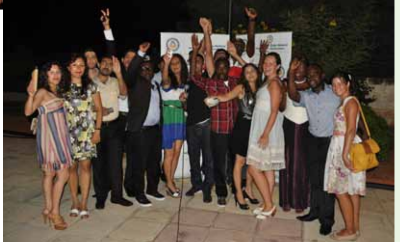
Mezuniyet Balosu'nda Bahar Dönemi mezunları eğlenceli saatler geçirdi

Öte yandan DAÜ Rektörlüğü tarafından 2011- 2012 Akademik Yılı Bahar Dönemi mezunlarına özel Mezuniyet Balosu da düzenlendi. 24 Haziran 2012 Pazar günü, saat 20:00'de, DAÜ Deniz Tesisleri'nde düzenlenen baloya gece kıyafetleri ve takım elbiseleriyle katılan mezunların heyecanı ve mutluluğu yüzlerinden okundu. Geceye,