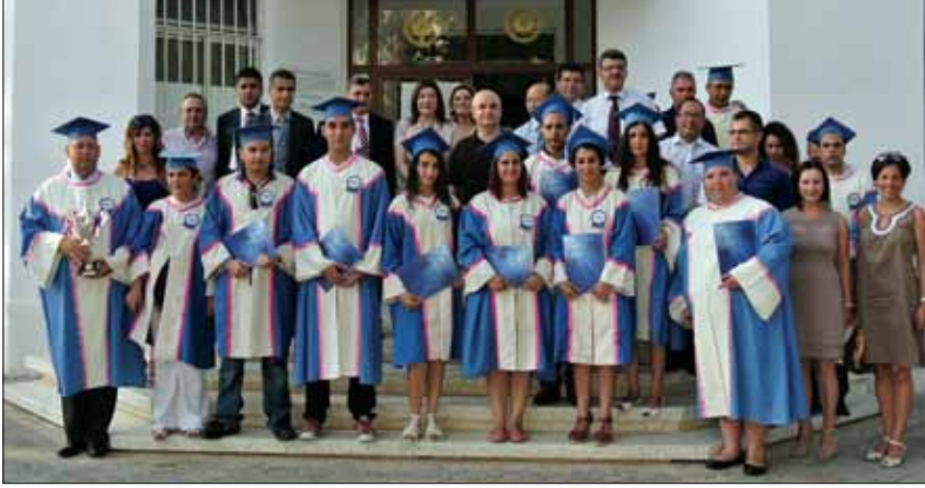
Aşçılık Ön Lisans Programı mezunları birarada