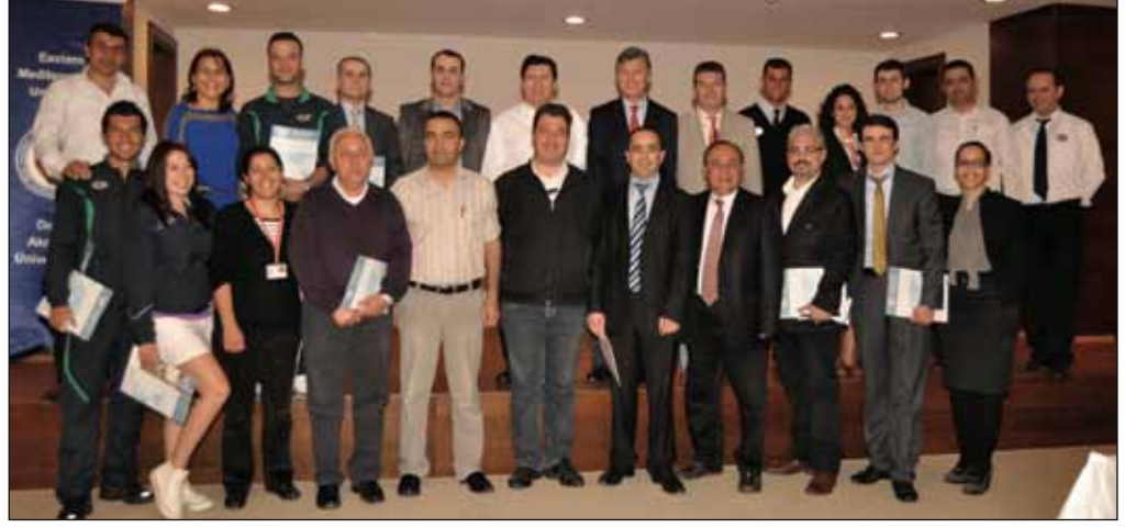
Viking Oteller Grubu Yöneticileri ve Personeli DAÜ-SEM'den eğitim aldılar