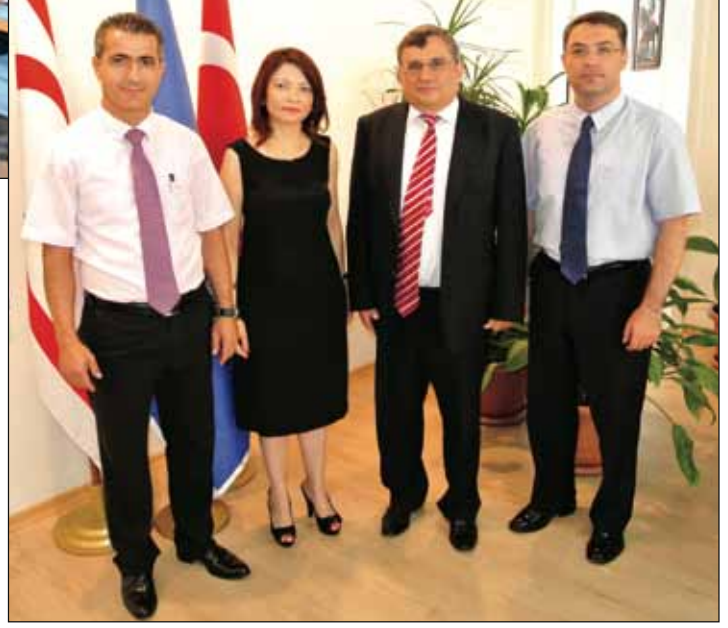
TRT Ekibi Rektörlük Makamı'nda