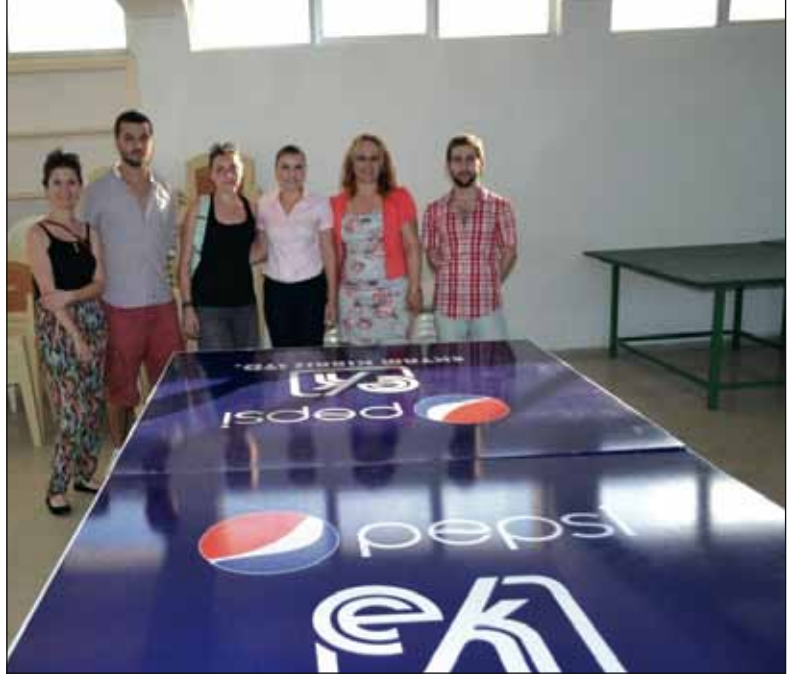
İletişim öğrencileri masa tenisi takımını Karpaz Meslek Lisesi'ne teslim etti

Uzunçam'ın düzenlediği bu yardım kampanyasında, Ektam Ltd. şirketi ve Önder alışveriş mağazaları sponsor olarak yer aldı.