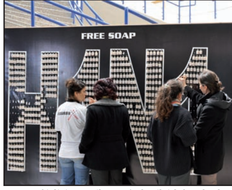
H1N1 etkinliği öğrenciler tarafından ilgiyle karşılandı.

Geçtiğimiz günlerde DAÜ Merkezi Derslikler Binası'nda gerçekleştirilen etkinlikte sabunun hayatımızdaki önemi vurgulandı. H1N1 de dahil, bu-laşıcı hastalıklara karşı etkili bir koruma yöntemi olan el temizliğinin önemini düşündürücü yöntemlerle vurgulamak ve bunun bir alışkanlık haline gelinceye kadar belli aralıklarla yaratıcı etkinliklerle hatırlatmayı bu aktivitede temel hedef edinen Flashback Action Team, bu tarz farkındalık