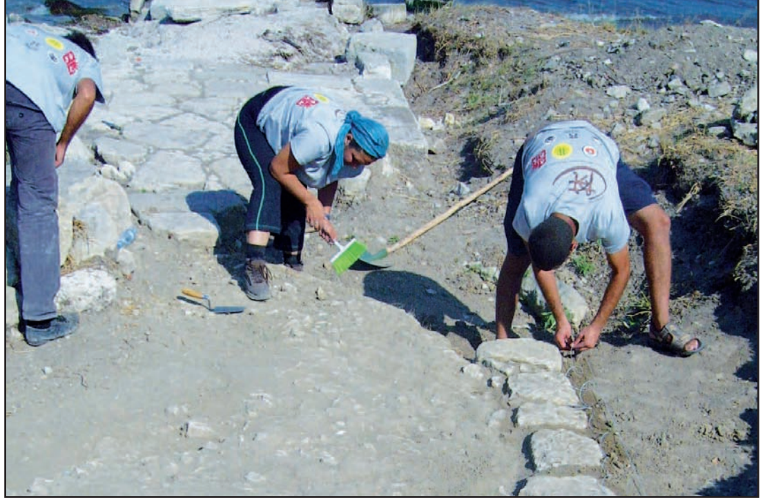
SAGAM üyeleri İstanbul kazılarında

birçok projeyi yürütüyor. Çalışmaları birçok uluslararası kurum tarafından kabul ediliyor ve yayımlanıyor. Sahip olduğu ekip, teknoloji ve donanım ile bu alanda dünyanın sayılı kurumları arasında yer alan DAÜ'nün başarıları, uluslararası çevrelerde kabul görüyor. DAÜ-SAGAM'ın bu başarıları politik engellemelere karşın bilimin kazanımlarını ortaya koyuyor.