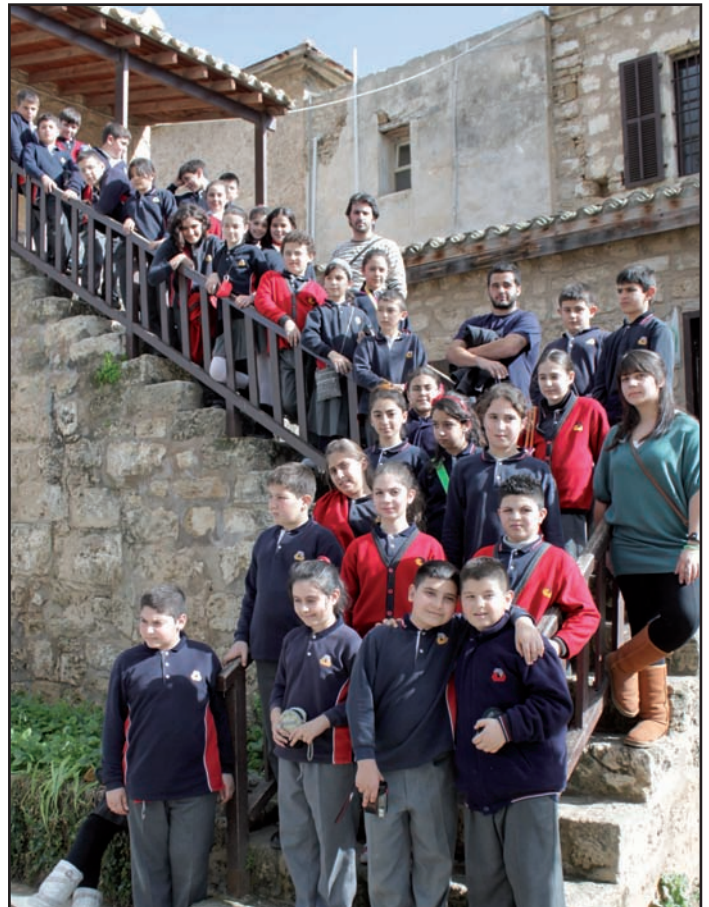
DAİ'li minikler DAÜ Mimarlık Fakültesi programı çerçevesinde Namık Kemal Zindanı'nı da incelediler.

Ortaya çıkan ürünler ise 25 Şubat 2010 Perşembe günü 14:00-15:30 saatleri arasında Doğu Akdeniz İlkokulu (DAİ) sergi salonunda sergilenmiştir.