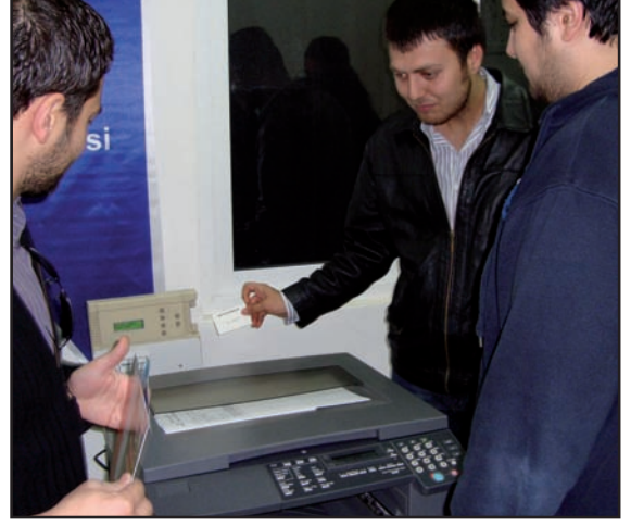
Öğrenciler artık “Copy Center” fotokopi makinelerini kullanabiliyor.