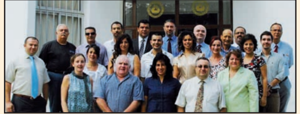
DAÜ Turizm ve Otelcilik Yüksek Okulu Öğretim Elemanları

Doğu Akdeniz Üniversitesi’nde (DAÜ) 2002-2003 Akademik yılında eğitime başlayan Turizm İşletmeciliği Yüksek Lisans Programı’ndan sonra e-Konaklama İşletmeciliği Yüksek Lisans Programı da başlıyor.