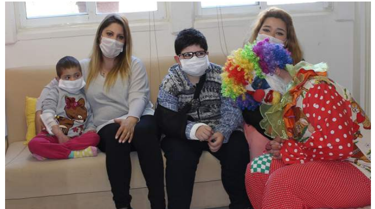
Öğrencilerimiz, Onkoloji Servisi'nde tedavi gören çocuklara eğlenceli anlar yaşattı