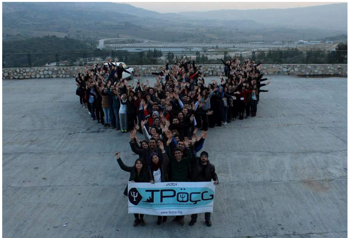
Psikoloji Kulübü öğrencileri birarada