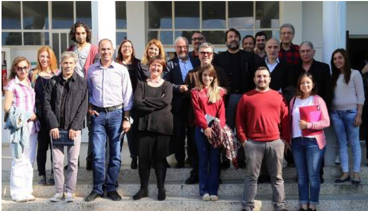
Söyleşi sonrası gazeteciler, akademisyenlerimiz ve öğrencilerimiz anı fotoğrafı çektiler