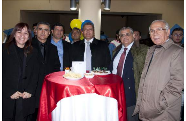
Mezunlarımız ve Aileleri Kente Veda gezisinde ve kokteylinde eğlenceli vakit geçirdiler