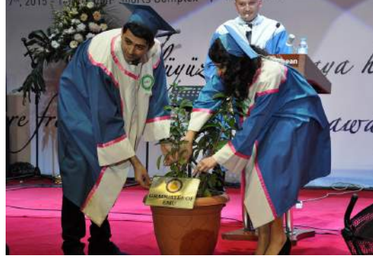
Birincilerimiz sembolik ağaç dikme töreni sırasında