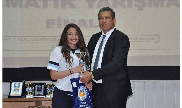
Yarışmada dereceye giren öğrencilere ödülleri verildi