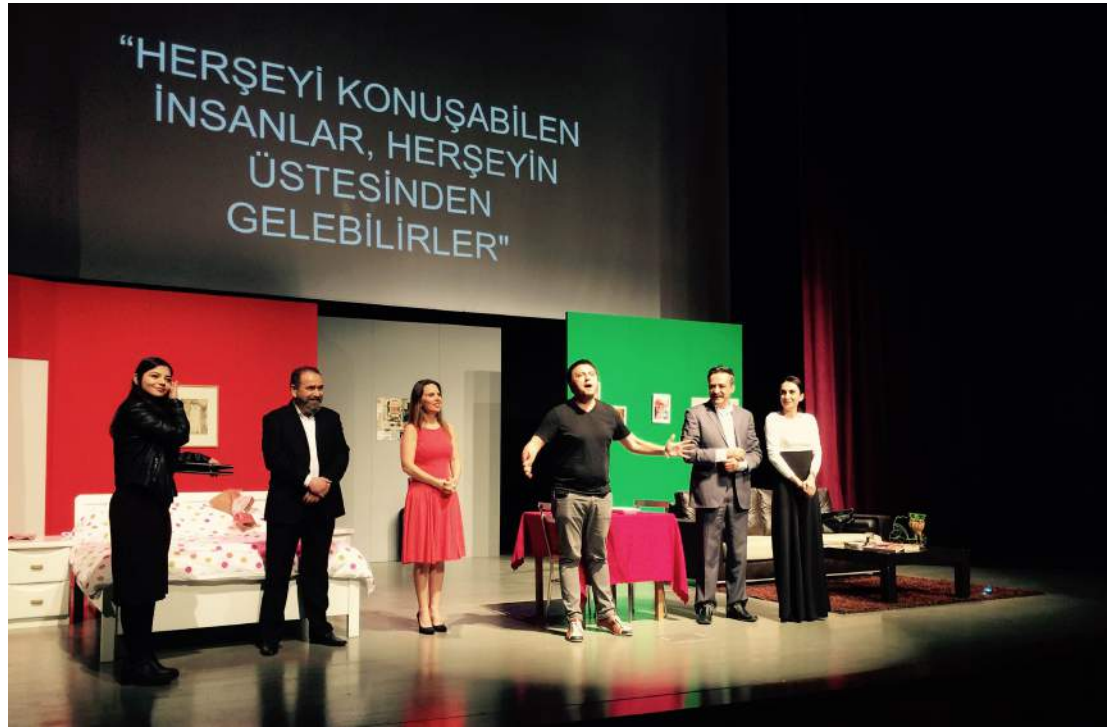
Tiyatro'dan bir sahne