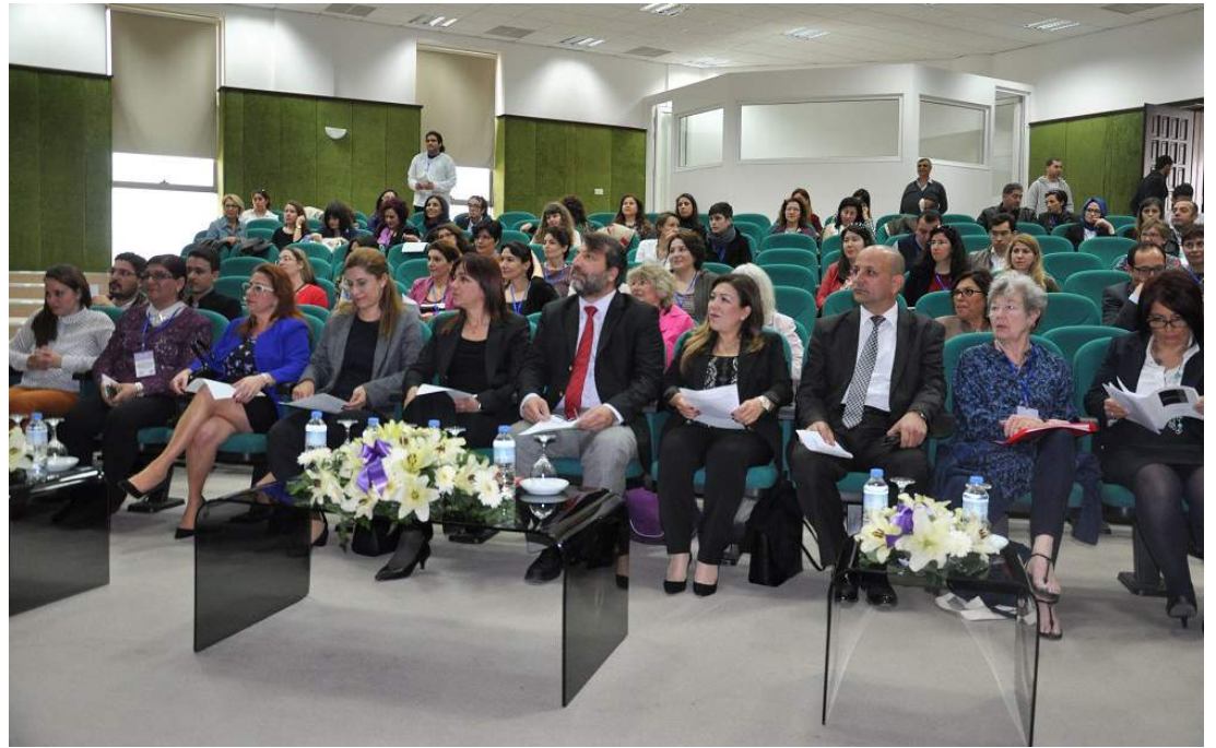
Rektör Yardımcılarımız, akademisyenlerimiz ve öğrencilerimiz semineri ilgi ile izledi