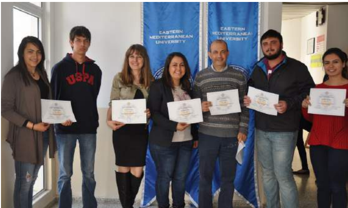
Sergide fotoğrafları yer alan öğrencilere sertifikaları verildi.