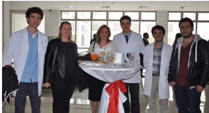
Öğrencilerimiz kokteyl sırasında