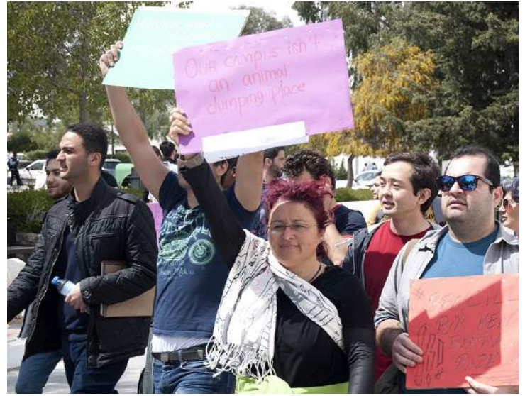
Anlamlı yürüyüşten kareler