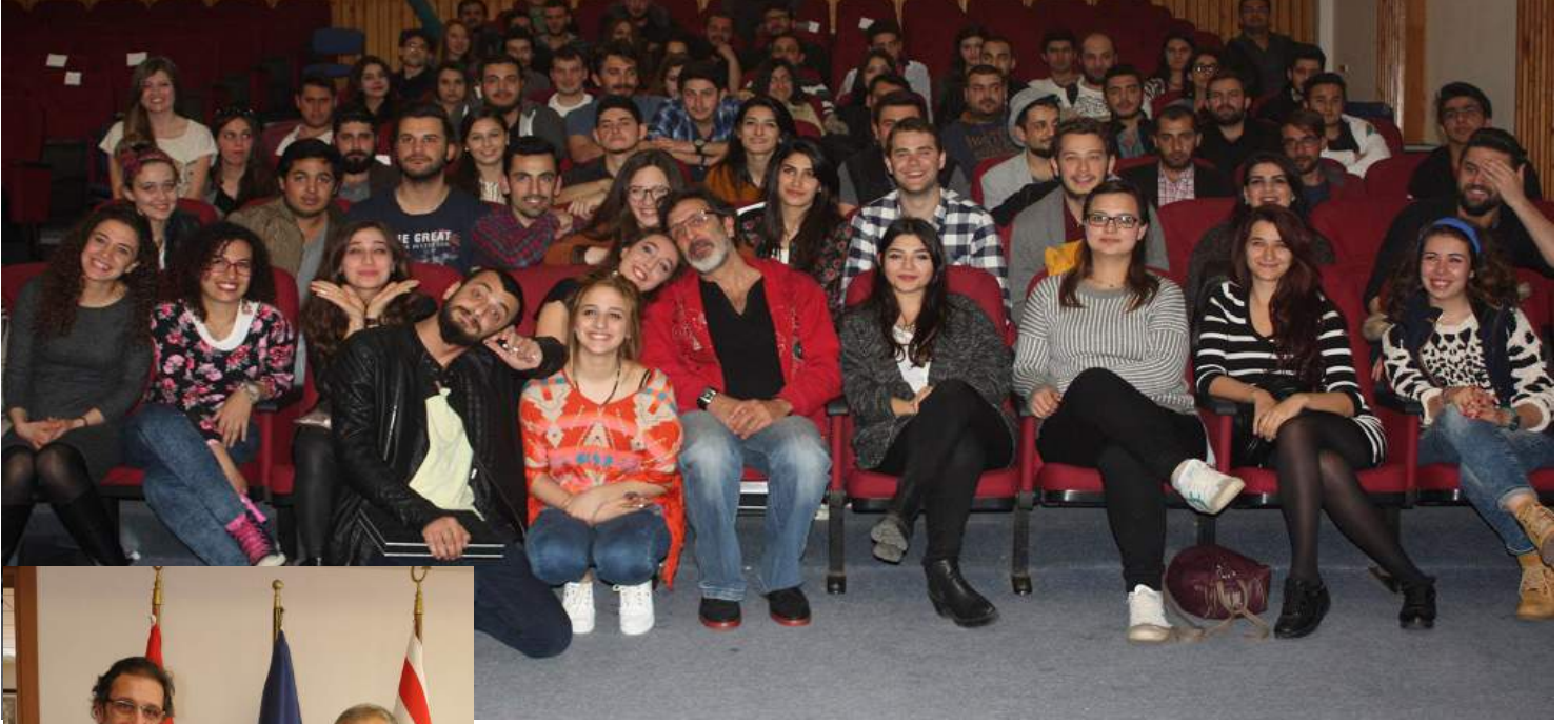
Cem Özer öğrencilerle anı fotoğrafı çekirdi

Doğu Akdeniz Üniversitesi (DAÜ) Sosyal ve Kültürel Aktiviteler Müdürlüğü'ne bağlı Müzikal Topluluğu tarafından organize edilen 5. Müzikal Şenliği'nin 2. gününde ünlü sanatçı Cem Özer'in konuk olarak katıldığı söyleşi Aktivite Salonu'nda gerçekleştirildi.