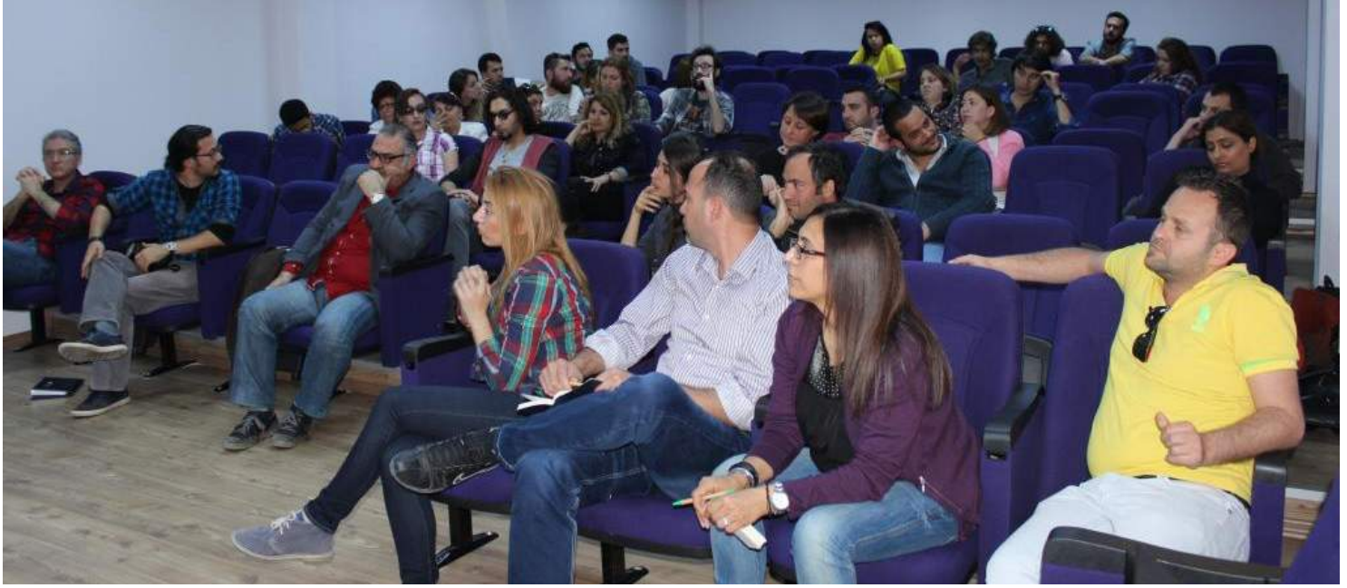
Öğrenciler, söyleşiyi ilgiyle izledi