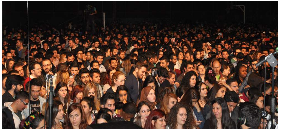
Öğrenciler Mor ve Ötesi ile coştı