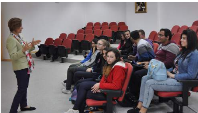
Atölye çalışmaları sırasında öğrenciler fakültelerimizi yakından tanıma fırsatı elde etti