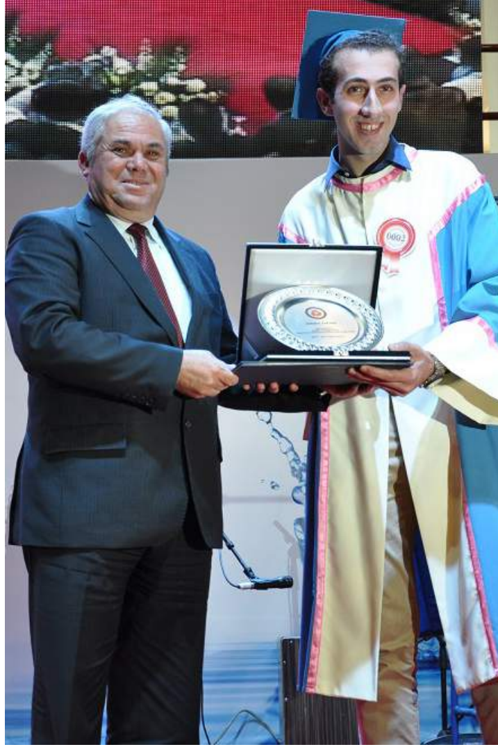
Başbakan Özkan Yorgancıoğlu mezununuza diplomasını verirken