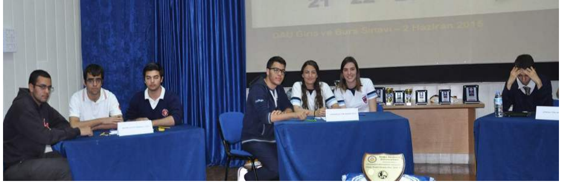
Yarışmada öğrenciler heyecanlı anlar geçirdi

Yarışma sonrasında düzenlenen törenle birinci Bülent Ecevit Anadolu Lisesi'ne ödülleri Gazimağusa Belediye Başkanı ve DAÜ Vakıf