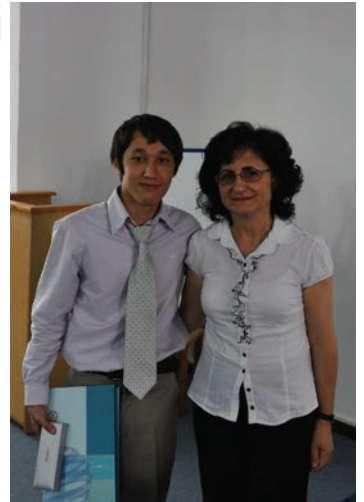
Bölüm öğrencileri sertifika aldılar