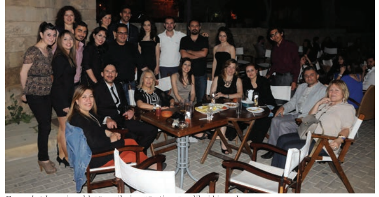
Geceye katılan mimarlık öğrencileri ve öğretim görevlileri birarada

rencileri arasında üstün başarı göstermiş olanlara yüksek şeref ve şeref sertifikalarının öğretim üyeleri tarafından verilmesi ile son buldu.