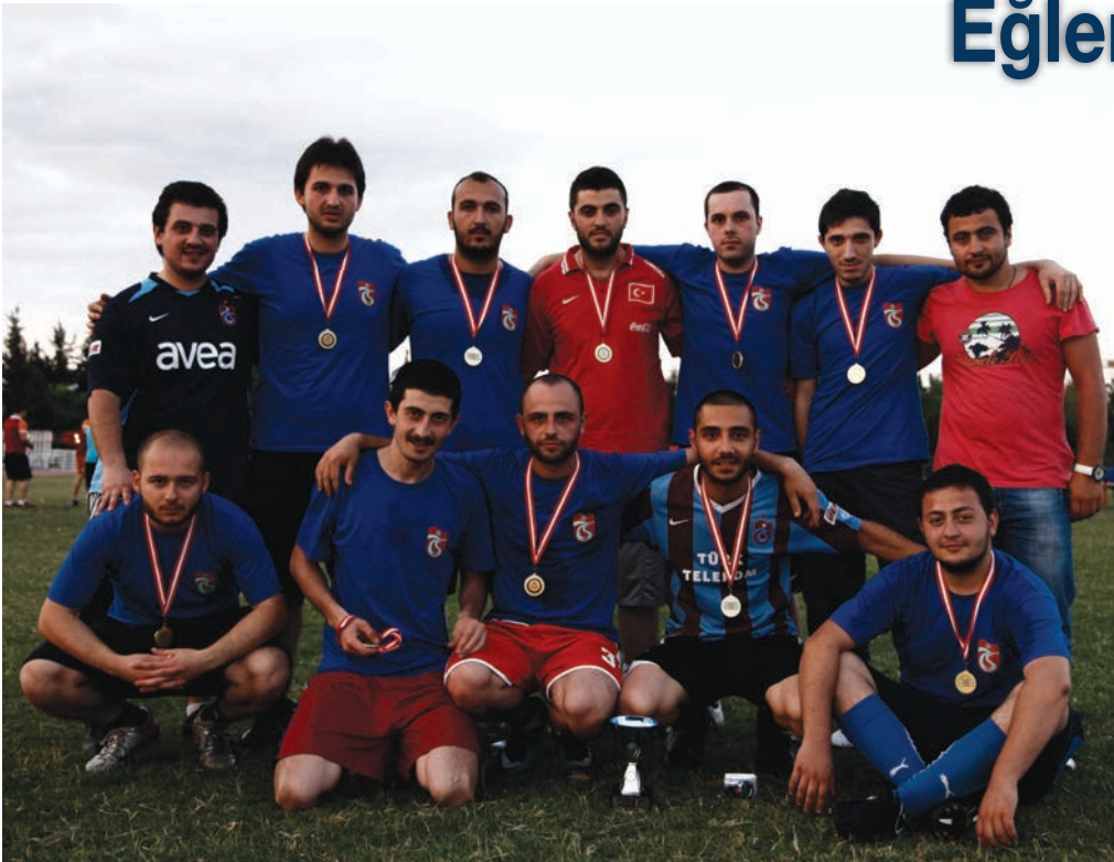
“Seven a Side” futbol turnuvası’nda ödül alan takımımız