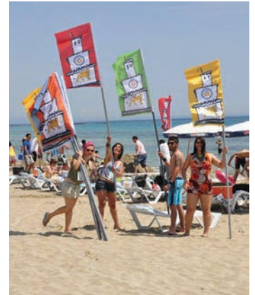
Festivale katılan gençler eğlenceli bir gün geçirdi

kesinde yapılan bu türden festivalleri ülkemizde de yapmak ve ülkemizin doğal güzelliklerinden faydalanarak alternatif aktiviteler yaratmaktır. Diğer yandan geleneksel hale gelmiş bu organizasyonu uluslararası boyuta ulaştırarak ülkeyi ve Üniversitemizin tanıtımına katkıda bulunmak amaçlanmaktadır. Bu bağlamda bu yıl gerçekleştirilen etkinlik gerek katılımcı sayısı, gerekse başarılı organizasyonu ile katılımcı ve izleyicilere unutulmaz bir festival havası yarattı. DAÜ'nün sosyal ve kültürel anlamda ülkemize kazandırdığı bu festival ve yarışma etkinliği, gelecekte de adından çok söz ettirecek ve uluslararası boyuta ulaşacaktır.