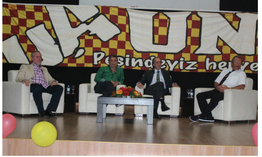
UltraAslan misafirleri “Futbol Kaosunda Galatasaraylılık Duruşu”nu tartıştılar