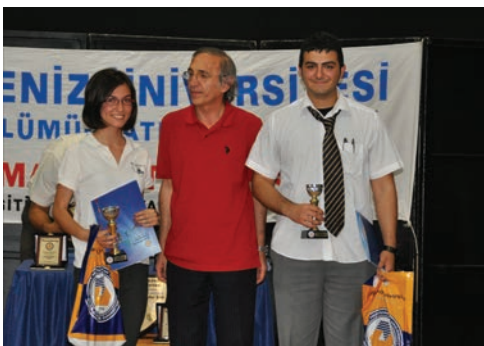
Yarışmanın bireysel birincileri