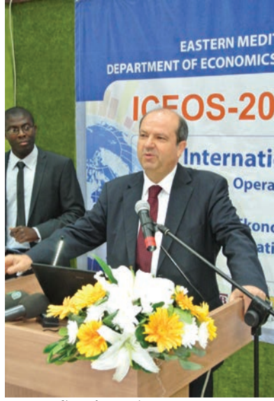
KKTC Maliye Bakanı Ersin Tatar

Bu yıl, ICEOS'un ilk kez Türkiye sınırları dışına çıkıp DAÜ Ekonomi Bölümü'nün evsahipliğinde gerçekleştiğini ifade