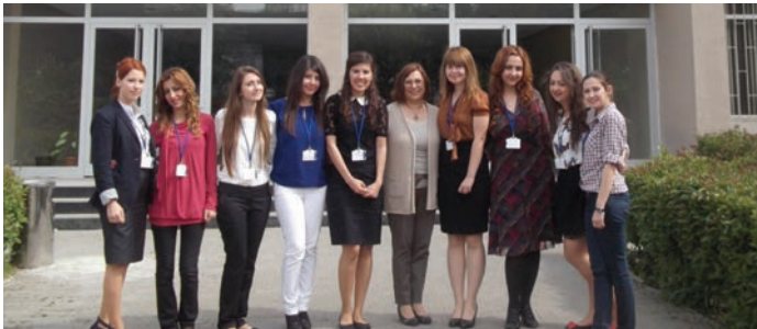
Kongreye katılan öğrencilerimiz birarada