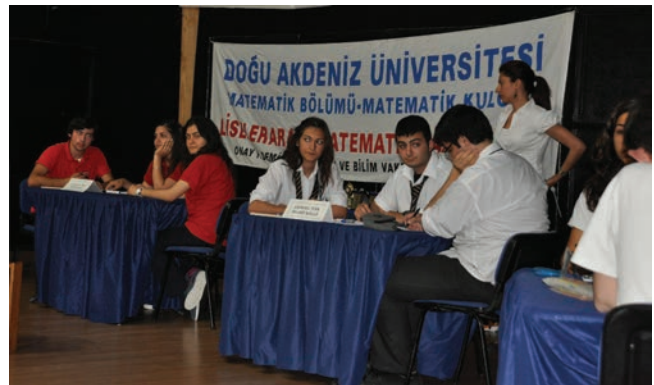
Liseler yarışmada dereceye girmek için ter döktü