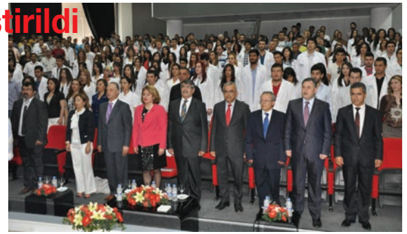
Törene yoğun bir katılım oldu