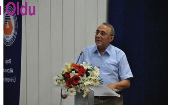
Prof. Dr. Ataol Behramoğlu

dından sevilen şiirlerini dinleyicilerle paylaştı. Şiir, anı, gezi, inceleme, deneme türlerinde pek çok kitabı ve çevirisi yayınlanan ünlü şair Prof. Dr. Ataol Behramoğlu, bugüne kadar pek çok sağlık sektörü etkinliğine davet edildiğini aktarırken sanatçıların ve sağlıkçıların birbirlerine çok yakın olduğunu, ikisinin de amacının insanları daha sağlıklı, daha mutlu ve daha verimli hale getirmek olduğunu sözlerine ekledi.