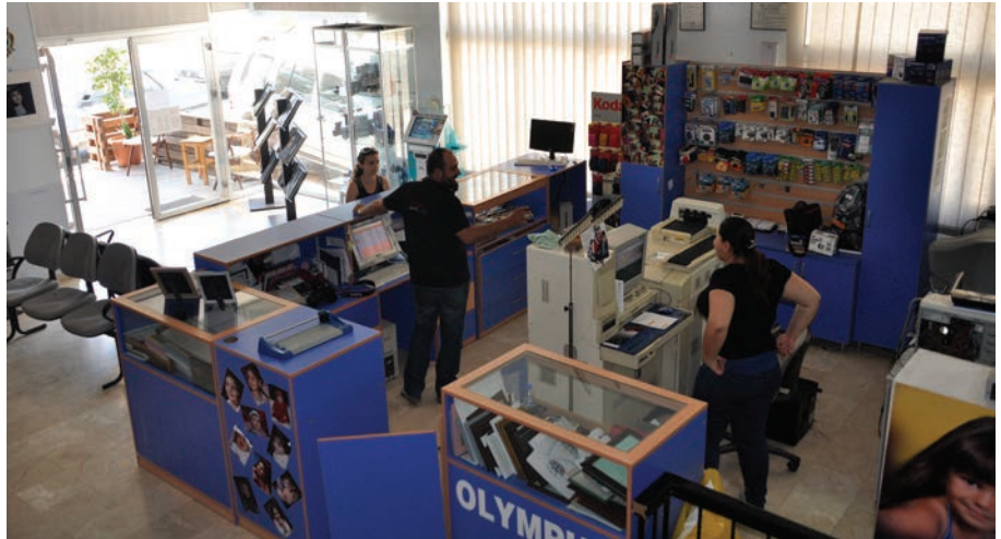
Foto Özay, birçok marka ve model seçenekleri ile DAÜ karşısında ve Gazimağusa Sürüçü'nde hizmet veriyor