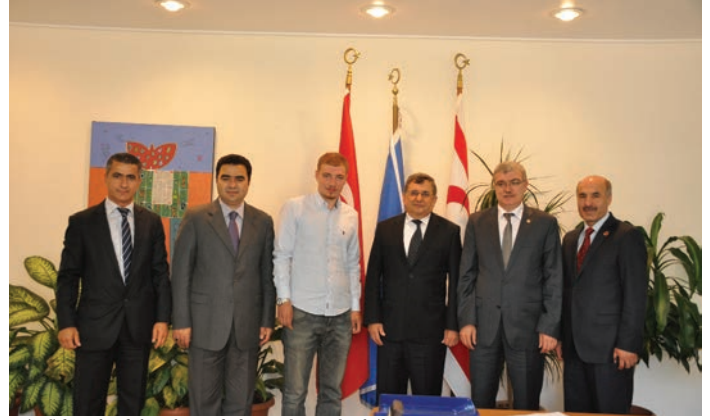
Misafirler rektörlük makamında hatıra fotoğrafı çektiler