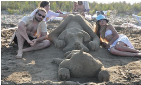
Yarışmacılar birbirinden ilginç heykeller yaptı