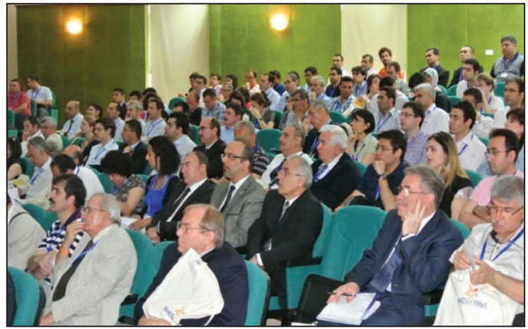
Konferansa 500'ün üzerinde katılımcı kayıt yaptı

Bakan Tatar, ekonominin hayati önem taşıdığını anlattığı konuşmasında güvenilir ekonomik verilerin siyasilerden değil, akademisyenlerden geldiğini belirtti. Bakan Tatar, DAÜ Ekonomi Bölümü'nün sık sık hükümet ile işişare içerisinde bulunup, DAÜ