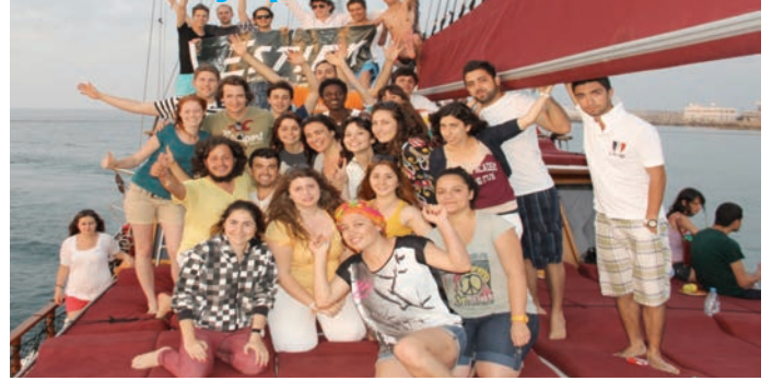
ESTIEM seminerlerine katılan öğrenciler sosyal aktivitelere de katıldılar

Doğu Akdeniz Üniversitesi (DAÜ) Mühendislik Fakültesi, Endüstri Mühendisliği Bölümü Öğrenci Kulübü (IE-Club), geçtiğimiz günlerde ESTIEM'in (European Students of Industrial Engineering and Management - Avrupa Endüstri Mühendisliği Öğrencileri Birliği) en önemli organizasyonlarından biri olan "Vision Seminerleri"ne ev sahipliği yaptı. Dünyanın en büyük öğrenci kulüpleri topluluğu olan ESTIEM'e Avrupa'nın 24 ülkesinden toplam 66 Endüstri Mühendisliği Öğrenci Kulübü üye. DAÜ Endüstri Mühendisliği Öğrenci Kulübü IE-Club aynı zamanda Güney Kıbrıs dahil ESTIEM'e üye adadaki tek öğrenci kulübü. Bu yıl 7.si düzenlenen ve Almanya, Hollanda, İspanya,