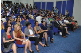
Şiir dinletisine yoğun katılım oldu

Hemşirelik Haftası kapsamında Doğu Akdeniz Üniversitesi (DAÜ) Sağlık Bilimleri Fakültesi'nin düzenlediği etkinliğe ünlü şair, yazar ve akademisyen Prof. Dr. Ataol Behramoğlu ko-