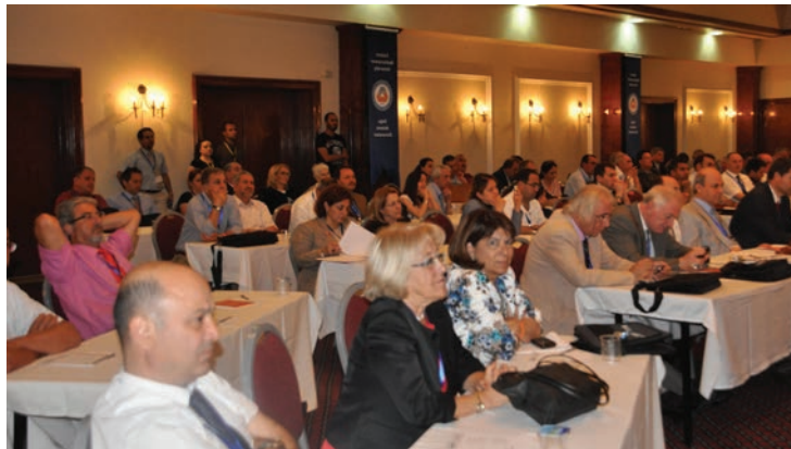
Toplantıya Türkiye ve KKTC'nin ilgili fakülte dekanlarının tamamına yakını katıldı