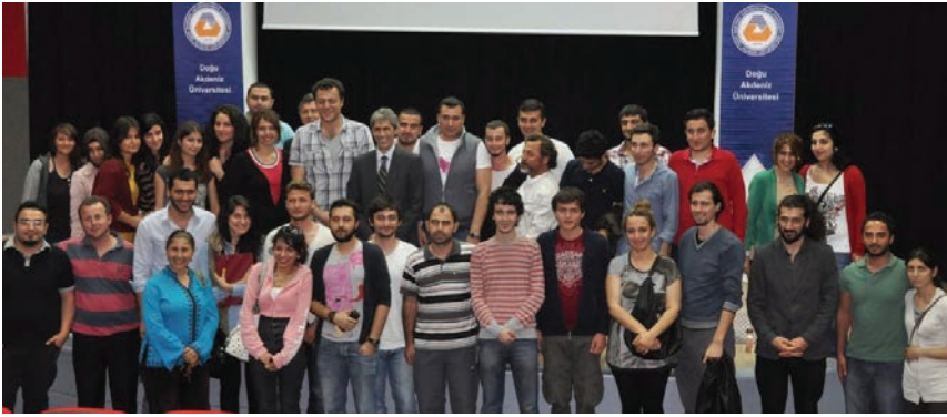
Ünlü oyuncular İletişim öğrencileri ile fotoğraf çektiler