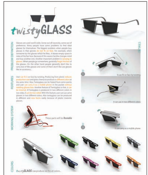
Ender Yavuz'un "Twisty Glass" tasarımı

len akademisyenleri ve tasarımcıları ile bir araya getirme düşüncesiyle başlatıldı. İlk, orta, lise ve üniversite öğrenci kategorileri içerisinde düzenlenen tasarım olimpiyatına bu yıl 34 ayrı ülke, toplam 3494 proje katıldı, bunlardan 111 proje sergilemeye layık bulundu. Uluslararası jüri binlerce proje arasından seçimlerini yaptı. DAÜ Öğrencisi Hikmet Ender Yavuz'un projesi bu yarışmada Üniversite öğrencileri kategorisinde üçüncülük Ödülü'ne layık görüldü. Öğrencimiz geçen sene de aynı yarışmada finalistler arasında yer almış ve mansiyon ödülü almıştı.