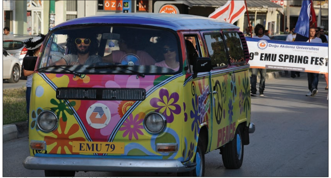
1970'li yılları anımsatan festival aracı oldukça ilgi çekti

Doğu Akdeniz Üniversitesi'nin (DAÜ), Kuzey Kıbrıs Türkcell ana sponsorluğunda 17-20 Mayıs 2012 tarihleri arasında gerçekleştirdiği 19. Bahar Festivali tam anlamıyla karnaval tadındaydı. 17 Mayıs 2012 Perşembe günü, saat 17:30'da Sakarya Çemberi'nden üniversite kampüsündeki şenlik alanına kadar yapılan kortej yürüyüşüne tüm akademik ve yönetsel birimler, öğrenci kulüplerinin temsilcileri ile çok sayıda DAÜ'lü öğrenci katıldı. "Retro EMU" konseptinde belirlenen bu seneki Bahar Festivali kortejinde "Retro Şenlik Arabası" halk tarafından yoğun ilgiyle karşılandı. Mehter Takımı eşliğinde yapılan coşku dolu kortej yürüyüşüne zaman zaman yoldan geçen bölge halkı da eşlik etti. Üniversite kampüsüne kadar olan yürüyüş, şenlik alanına gelinmesiyle son buldu. Şenlik alanında Mehter Takımı çaldığı marşlarla alandaki kalabalığı coşturdu. Kulüplerin standlarda yerlerini almaları ile birlikte kalabalık şenlik alanına dağıldı.