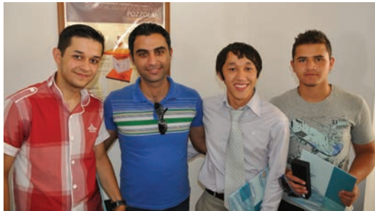
Başarıları ödüllendirilen öğrenciler oldukça mutluydu