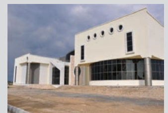
Rauf Raif Denktaş Kültür ve Kongre Sarayı

tür saraylarından biri konumunda olan Gazimağusa Kültür ve Kongre Merkezi'nin ismi ise, yakın geçmişte ebediyete intikal eden Kurucu Cumhurbaşkanı ve Kıbrıs Türkünün varoluş mücadelesinin büyük önderi Rauf Raif Denktaş'ın ismiyle anılacak ve "Rauf Raif Denktaş Kültür ve Kongre Sarayı" olarak bilinecek. DAÜ ailesi, alınan bu kararla Kıbrıs Türk tarihinin iki büyük liderine bir nebze de olsa vefa borcunu ödendiğini düşünerek mutluluk duymaktadır.