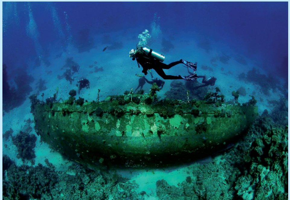
Festivalde sualtı ile ilgili birçok resim ve film gösterimi gerçekleştirildi.

Festivalin yarışma bölümlerinde 2005 ve 2006 yıllarında çekilmiş sualtı film ve belgeselleri ile fotoğraflar yer aldı. Sualtı film ve belgesel-