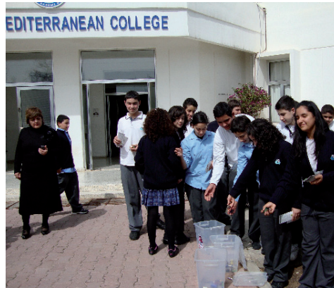
DAK öğrencileri "Atık Pil Toplama" çalışmasına ilgi gösterdiler.