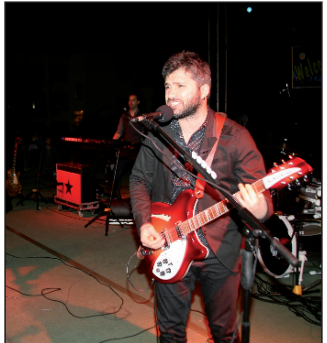
Grup REDD'in performansı öğrenciler tarafından beğenildi.