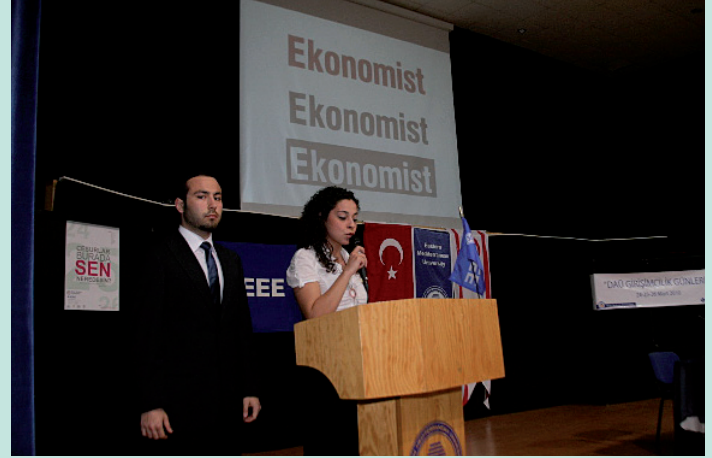
Birçok genç girişimci DAÜ öğrencileri ile buluştu.