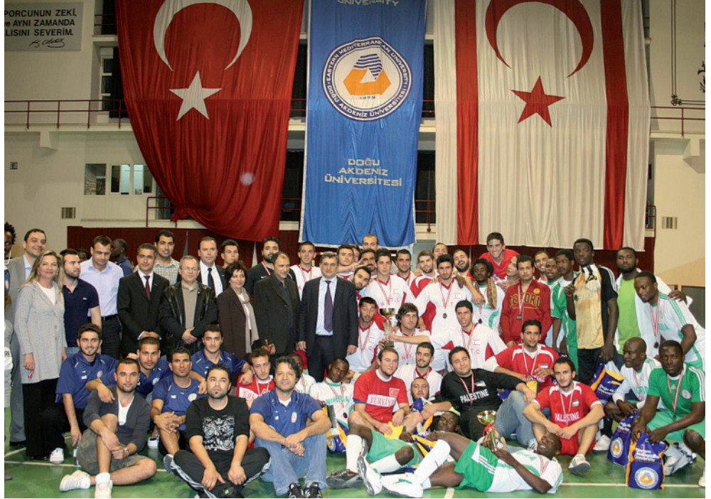
Organizasyon sonunda KKTC, Nijerya ve TC takımları DAÜ yönetimi ile hatıra fotoğrafı çektiler.