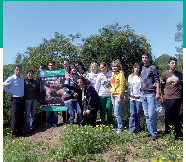
İletişim Fakültesi öğrencileri Bedis Piknik Alanı'na fidan diktiler.

Dikime katılan İletişim Fakültesi öğrencileri, etkinlikte dikilen fidanların kendileriyle birlikte can bulduğu için çok mutlu olduklarını söylediler.