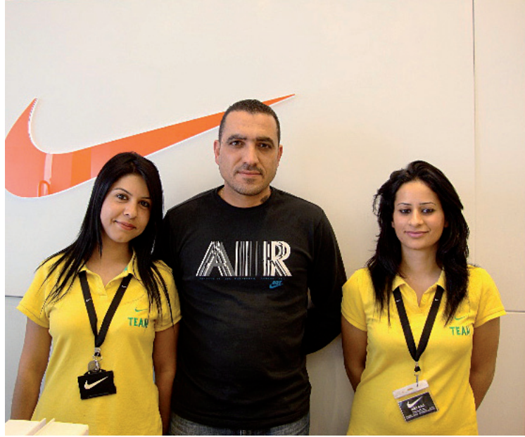
İranlı turistlerin 15 gün boyunca alışveriş yaptıkları Gazimağusa'daki çeşitli iş yeri ve çarşı grubu esnafta yoğun ilgiden memnun kaldı.

İranlı turistlerin 15 gün boyunca alışveriş yaptıkları Gazimağusa'daki çeşitli iş yeri sahipleri DAÜ'nün bu girişiminin mutluluk verici olduğunu söyleyerek bu tarz turların devamını dilediler.