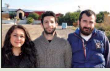
Projeyi gerçekleştiren öğrenciler