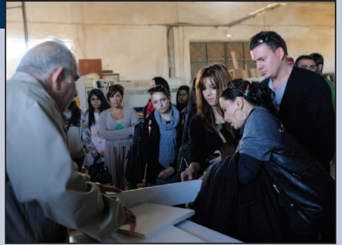
İç Mimarlık öğrencileri gezileri sırasında farklı teknikler öğrendiler