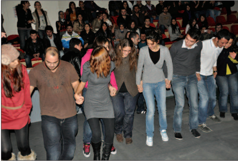
Öğrenciler Kubat'ın türkülerini ile eğlenceli dakikalar yaşadılar

kendisine has yorumuyla sahne alan Kubat, türkü severlere unutulmaz bir konser verdi. Kubat konserinde “Gesi Bağları”, “Karaağaç”, “Misket” gibi eskimeyen parçalarına yer verdi. Aralıksız bir buçuk saat türkülerini seslendiren Kubat'ı dinlemeye doyamayan izleyenler kendisine büyük tezahüratta bulundular. Gece, Kubat'a plaket ve çiçek takdimiyle sona erdi.