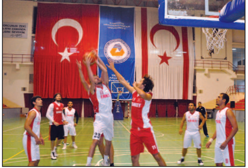
Maçlarda heyecan hakimdi

Baştan sona çekişmeli geçen Türkiye, KKTC, Sudan ve Kazakistan'ın oynadığı dördüncü final grubu maçlarının ardından, Kazakistan'ı mağlup eden Sudan turnuva 3'üncüsü olurken,