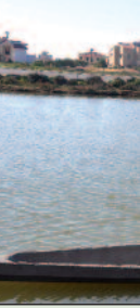
Betondan kano suya