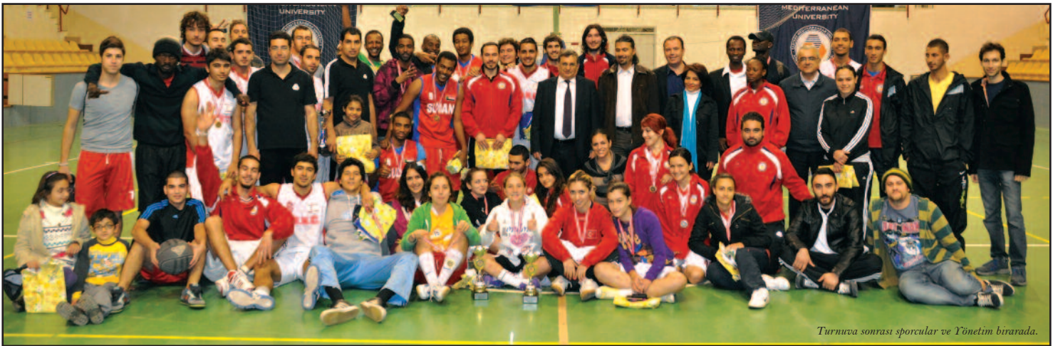
Turnuva sonrası sporcular ve Yönetim birarada.