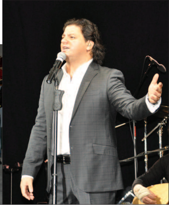
Kubat şarkılarını DAÜ'lüler için seslendirdi