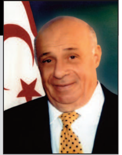
Kurucu Cumhurbaşkanı Rauf Raif Denktaş