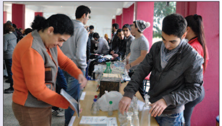
Öğrenciler kermes sırasında hem eğlendi hem de projelerinin hayata geçmesinin gururunu yaşadılar

Doğu Akdeniz Doğa Koleji 7. Sınıf öğrencilerine yaşlılara nasıl yardımcı olunabileceği konusunda farkındalığı artırma amaçlı sunum gerçekleştirdiler.