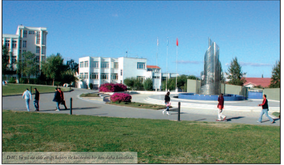
DAÜ, bu yıl da elde ettiği başarı ile kalitesini bir kez daha kanıtladı.

DAÜ'nün Eduroute tarafından yapılan sıralamada almış olduğu dereceler, yüksek öğretim kurumu