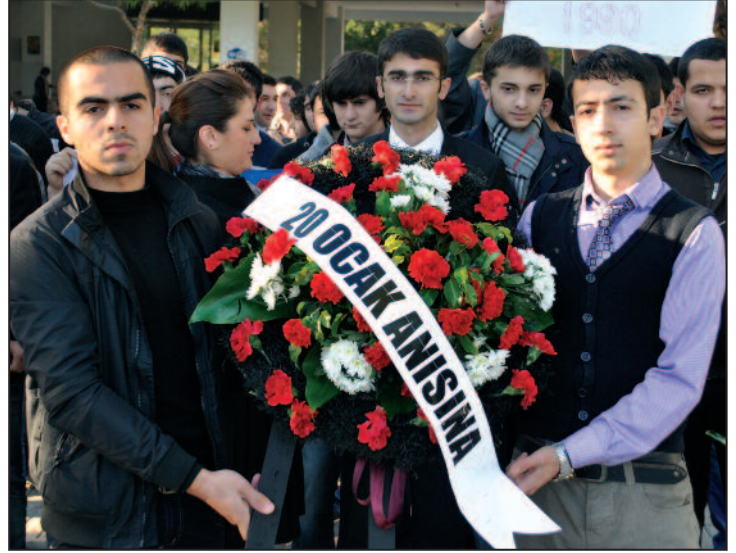
Azeri öğrenciler Atatürk Anıtı önüne çelenk bıraktı.