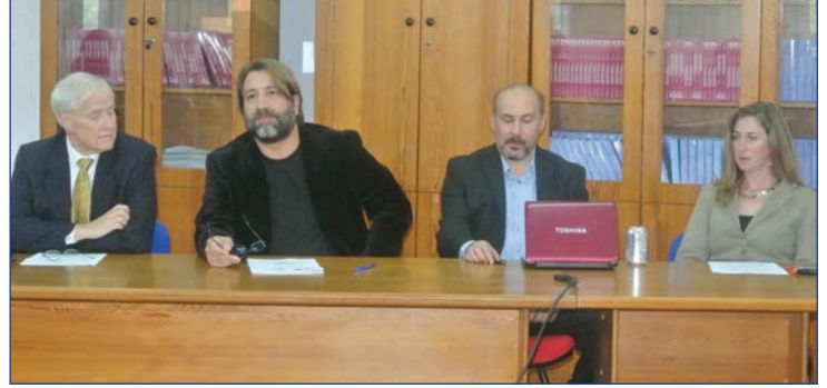
Panelde ABD Başkanlık seçimi ve sonuçları değerlendirildi.