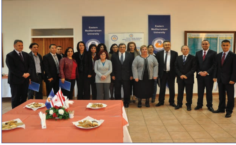
Sertifika Töreni'ne katılanlar birarada