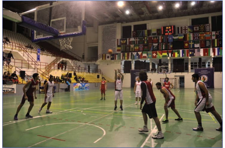
Final maçı heyecanlı dakikalara sahne oldu