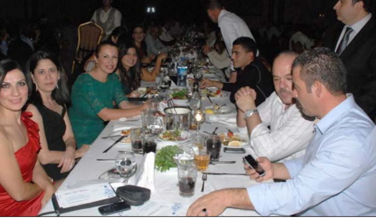
Yaklaşık 750 personel katıldı

düzenlenen Geleneksel DAÜ P Yeni Yıl Balosu 22 Aralık tarihinde Kaya Artemis Otel'de gerçekleştirildi. Bu yıl DAÜ Personeli DAÜ-PERSEN ile ortaklaşa düzenlenen geceye Doğu Akdeniz Üniversitesi'nin (DAÜ) akademik ve işçi kadrosundan yaklaşık katıldı.