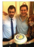
Mezunlarımız İstanbul'da Biraraya Geldi