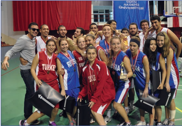
Türkiye ve Rusya basketbol takımları birarada

Muhteşem final gecesinde yapılan karşılaşmalar sonucunda turnuvaya damgasını vuran takım Türkiye oldu. Hem erkek hem de bayan kategorisinde birinciliği elde eden Türkiye takımının sevinci görül-meye değerdi. Turnuvada elde edilen diğer sonuçlar ise şöyle: Erkeklerde Filistin dördüncü, Ni-jerya üçüncü, KKTC ikinci olurken, bayanlarda ise KKTC üçüncülüğü, Rusya ikinciliği elde etti. Karşılaşmaların ardından final gecesine yakışır bir ödül töreni ile dereceye giren takımlara ödül ve hediyeleri verildi.