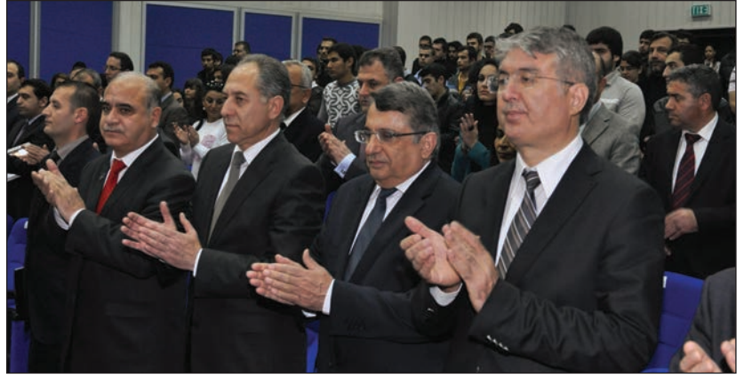
Konferans yoğun bir katılımıla gerçekleşti

Bakan Atasayan'ın ardından konuşan TC Lefkoşa Büyükelçisi Halil İbrahim Akça Azerbaycan'ın geleceği için destek vermeye devam edeceklerini aktararak Azerbaycan'ın bağımsızlığını kazandıktan sonra yürüttüğü politikayı desteklediklerini ve Azerbaycan'ın millet olma bilincine erişmiş bir ülke olduğunu sözlerine ekledi. Büyükelçi Akça KKTC'nin her zaman kendi bayrağına, toprağına ve