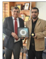
Öğrencimiz Almanya'da Altın Madalya Kazandı