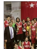
Uluslararası Basketbol Turnuvası Muhteşem Final Gecesi ile Sona Erdi