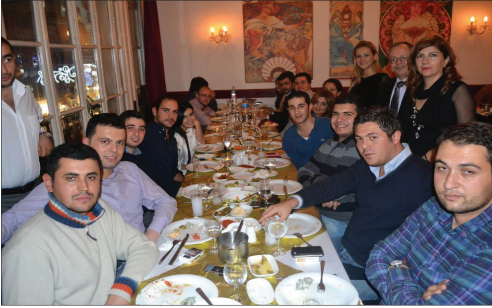
Geceye İstanbul'da yaşayan mezunlarımızdan yoğun katılım oldu