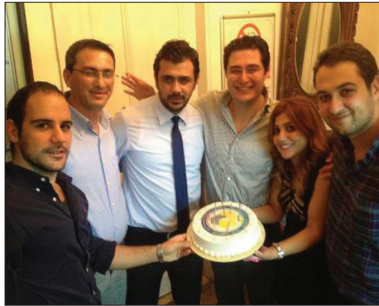
Geceye DAÜ logolu pasta da kesildi