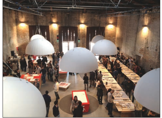
Bienal'den bir görüntü