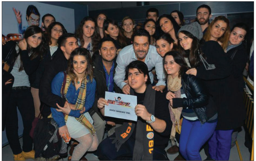
Öğrencilerimiz Beyazıt Öztürk'le hatıra fotoğrafı çektiler

Sunuculuğunu Beyazıt Öztürk'ün yaptığı Beyaz Show'un konukları, üniversiteli öğrenciler tarafından çok sevilen, pop müziğin güçlü isimlerinden Bengü; "Ağır Roman" dizisi oyuncularını Tamer Tıraşoğlu, Özge Özpırınç ve Nesrin Cavazade; yaşam koçu Tuğçe İşinsu ve müzik dünyasının son dönem yükselen isimlerinden Ece Seçkin'di.