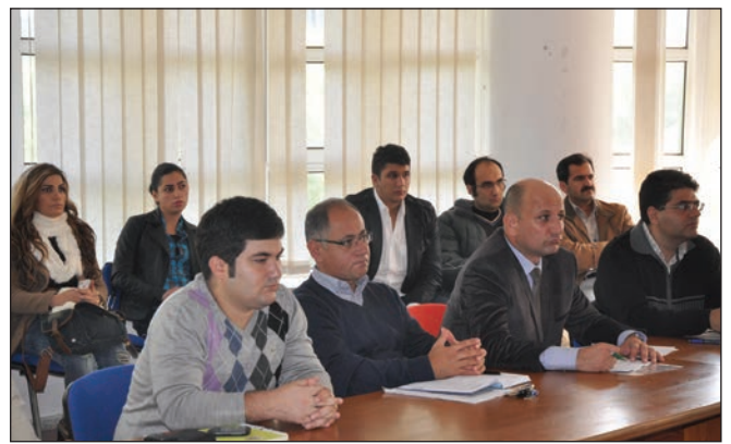
Seminere öğretim üyeleri ve öğrenciler yoğun ilgi gösterdi.

Öğrencilere IMF’nin profesyonel kadrolarını oluştururken özellikle hangi eğitim ve deneyime sahip elemanlar aradığını aktaran Huddleston, IMF’de muhtemel bir kariyer için nasıl hazırlanması gerektiği ve nelere öncelik verilmesi konusunda tavsiyelerde bulundu. Huddleston ayrıca 1949 ile 2000’li yıllar arasında dünyanın çeşitli bölgelerinde meydana gelen kriz ve sorunlardan bahsederek, 2000’li yıllarda çeşitli ülkelerin IMF ve Dünya Bankası’na olan borçlarını ödeyememesinin sonucu oluşan kriz, daha sonra ülkelerin IMF yerine dünya piyasalarından IMF koşulları olmadan borçlanmaya başlaması ve Euro bölgesi krizi üzere dokuz ana kriz ile ilgili izlenimlerini aktardı.