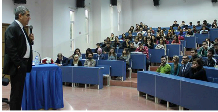
Prof. Dr. Süheyl Batum Hukuk Fakültesi'nde öğrencilere konferans verdi

Türkiye Büyük Millet Meclisi (TBMM) Milletvekillerinden, Anayasa Hukuku Profesörü Süheyl Batum, Doğu Akdeniz Üniversitesi (DAÜ) Hukuk Kulübü tarafından organize edilen konferansa katılmak üzere Kuzey Kıbrıs Türk Cumhuriyeti'ne (KKTC) geldi. Prof. Dr. Süheyl Batum'un "Hukuk Devleti ve Yargı Bağımsızlığı" konulu konferansı, büyük bir katılımıyla DAÜ Hukuk Fakültesi LAW A1 Amfisinde gerçekleştirildi.