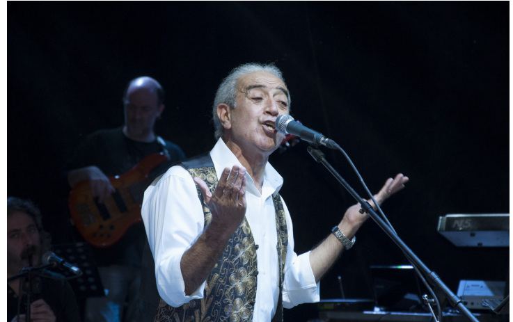
Edip Akbayram, sesiyile hem öğrencilerimizi hem de halkımızı büyüledi