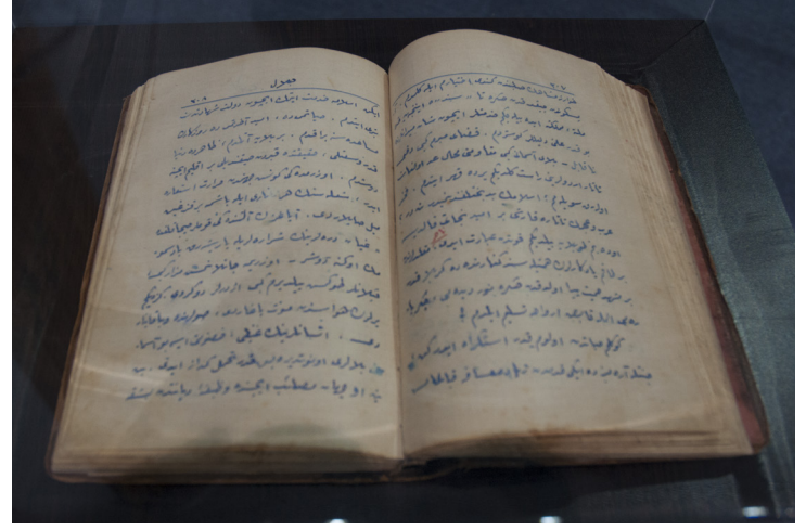
Namık Kemal’in El Yazması Kitabı

Panel sonrasında Namık Kemal Lisesi öğrencileri tarafından şiir dinletisi sunuldu. Ardından ise Namık Kemal Lisesi ile yapılan ortak çalışma sonucunda düzenlen-