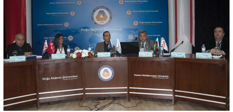
Gerçekleştirilen oturumlardan bir kare

Cumhurbaşkanı Eroğlu, "Kıbrıs konusu bugün hala çözümlenememişse, Rum tarafı hala uzlaşmazlığını sürdürüyorsa bunun arkasında uluslararası aktörlerin ada ile ilgili çıkarları ve hesapları vardır" dedi. Kıbrıs'ın etrafındaki coğrafyada yaşanan çatışma ve gerginliklere dikkat çeken Eroğlu, ada etrafında hidrokarbon rezervlerinin keşfedilmesi, bölgedeki enerji kaynaklarına ilişkin gelişmelerin ve bunların ortaya çıkardığı çıkar örtüşmelerinin Kıbrıs konusu oldukça etkilemeye başladığını belirtti. Cumhurbaşkanı Eroğlu, Kıbrıs'ta Türk askerinin varlığı sayesinde huzur ve istikrarın