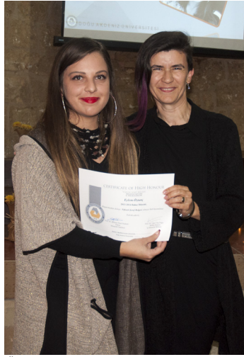
Öğrencimize sertifikası takdim edilirken