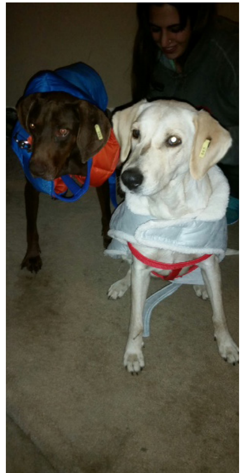
Sam ve Moose

Sam'in tedavisi Medica Animale Veteriner kliniği; Moose'un tedavisi ise Petcross Veteriner Kliniği tarafından yapıldı. ABD'ye uçuş masrafları ve uçuş için güvenlik kafesleri, Internet aracılığı ve öğretim üyeleri tarafından yapılan bağışlarla oluşturulan bir fon ile desteklendi. Öğrenciyle aynı uçakta Lefkoşa'dan Chicago'ya uçmaları için gereken izin ve onay Türk Hava Yolları'ndan alındıktan sonra Samantha ve Moose sahipli olmanın, bir aileye kavuşmanın özgüveni ve mutluluğunu yaşamaya başladılar. Ercan Havalimanı'na transferleri DAÜ Rektörlüğü tarafından sağlandı. KAY Projesi yetkilileri projenin önümüzdeki yıllarda da sürdürüleceğini ve diğer üniversiteler başta olmak üzere tüm yerel yönetimlerde de benzer çalışmaların önemli ve gerekli olduğunu hatırlattılar.