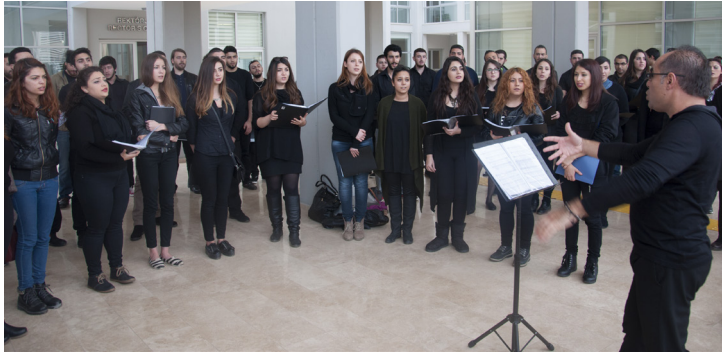
Müzik Öğretmenliği Programı Korusu Rektörlük Binası'nda mini bir konser verdi

Doğu Akdeniz Üniversitesi (DAÜ) Eğitim Fakültesi, Güzel Sanatlar Eğitimi Bölümü Müzik Öğretmenliği Programı bölüm korusu, dünya koro müziğine dikkat çekmek amacıyla 5 Aralık 2014 tarihinde, saat 15:30'da, DAÜ Rektörlük Binası bahçesinde minik bir konser gerçekleştirdi.