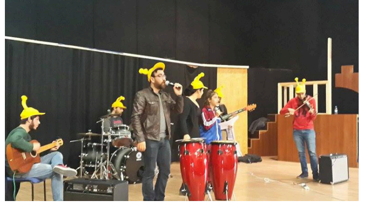
Mağusa Özel Eğitim Merkezi ve İrfan Nadir 18 Yaş Üstü Rehabilitasyon Merkezi öğrencileri etkinlikte keyifli zaman geçirdi