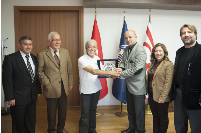
Edip Akbayram, DAÜ Rektör Yardımcıları ile birarada