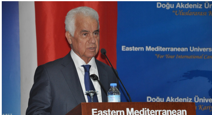
Cumhurbaşkanı Dr. Derviş Eroğlu açılış konuşmasını gerçekleştirdi