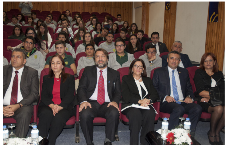
Etkinliğe DAÜ’den ve Namık Kemal Lisesi’nden yoğun katılım oldu