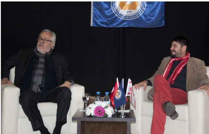
Rutkay Aziz öğrencilerle keyifli bir sohbet gerçekleştirdi

Usta Tiyatro Sanatçısı Rutkay Aziz ile Keyifli Bir Sohbet Tiyatro Topluluğu'nun oyununu izleyen tiyatro sanatçısı Rutkay Aziz ile ertesi gün Aktivite Salonu'nda keyifli bir söyleşi de gerçekleştirildi. Duayen sanatçı öğrencilerin tiyatro ile ilgili merak ettikleri tüm soruları büyük bir içtenlikle yanıtladı.