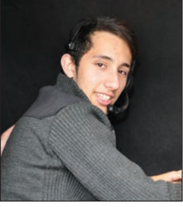
Bertu Hamitoğlu Haspolat Meslek Lisesi Son Sınıf Öğrencisi

DAÜ çok büyük ve güzel bir üniversite, Elektrik ve Elektronik Bölümü okumak istiyorum ve ilk tercih ettiğim üniversite kesinlikle DAÜ'dür. Tanıtım Günleri'nde şans eseri DAÜ TV Canlı Yayın aracında yönetmenlik yapma şansını buldum, aklımda olmayan bir mesleki ancak çok eğlenceli ve zevkli bir meslek olduğunu anladım.