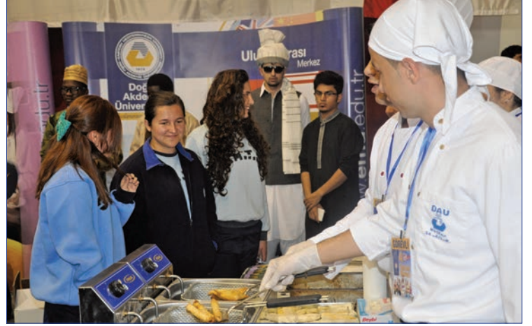
Etkinlikte lise son sınıf öğrencileri standlardan bilgiler aldılar