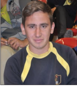
Sözer Sümer Cumhuriyet Lisesi Son Sınıf Öğrencisi

Ben DAÜ'ye ilk kez geldim. DAÜ KKTC'deki en iyi üniversite. Ben üniversite eğitimimi Sağlık Bilimleri üzerine düşünüyorum. DAÜ uluslararası standartlarda eğitim veren bir üniversite ve ben kesinlikle burada eğitim almayı düşünüyorum. Tanıtım Günleri de çok güzel ve eğlenceli geçiyor. Burada kendimizi yabancı gibi hissetmiyoruz.