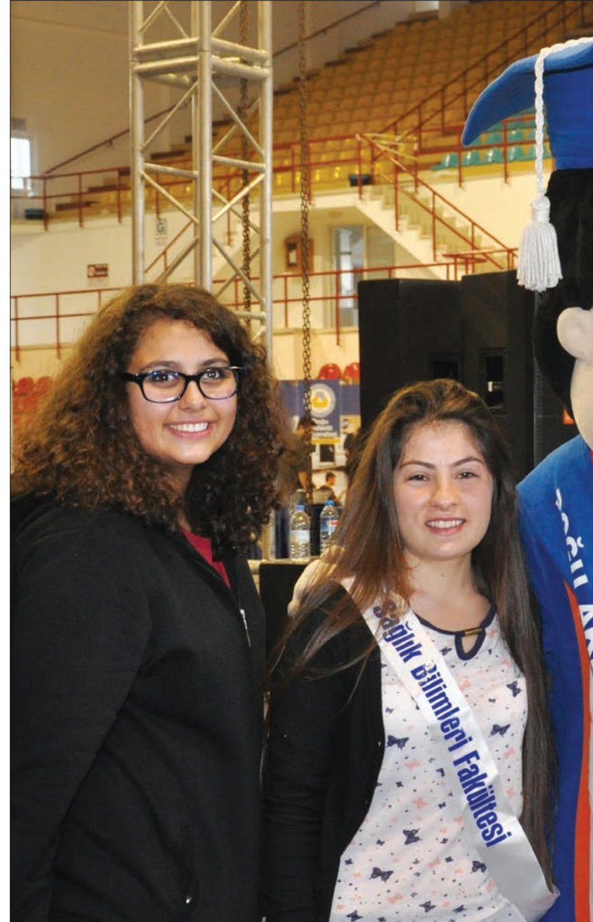
Lise son sınıf öğrencileri DAÜ maskotuyla bol bol hatıra fotoğrafı çektiler

DAÜ çok güzel ve gelişmiş bir üniversite. Ben daha önceden de DAÜ'ye gelmiştim. Ben henüz tam kararımı vermedim ama İletişim veya Elektrik-Elektronik Mühendisliği alanında eğitim almayı düşünüyorum. DAÜ kesinlikle tercihlerim arasında olan bir üniversite. Tanıtım Günleri sayesinde de bire bir konu uzmanı olan kişilerden bilgi aldım. Tanıtım Günleri sonunda kararlarımın daha net olacağını düşünüyorum.