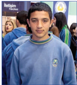
Kemal Çiftçiöğlü Karpaz Meslek Lisesi Son Sınıf Öğrencisi

DAÜ çok güzel ve gelişmiş bir üniversite. Ben daha önceden de DAÜ'ye gelmiştim. Ben henüz tam kararımı vermedim ama İletişim veya Elektrik-Elektronik Mühendisliği alanında eğitim almayı düşünüyorum. DAÜ kesinlikle tercihlerim arasında olan bir üniversite. Tanıtım Günleri sayesinde de bire bir konu uzmanı olan kişilerden bilgi aldım. Tanıtım Günleri sonunda kararlarımın daha net olacağını düşünüyorum.