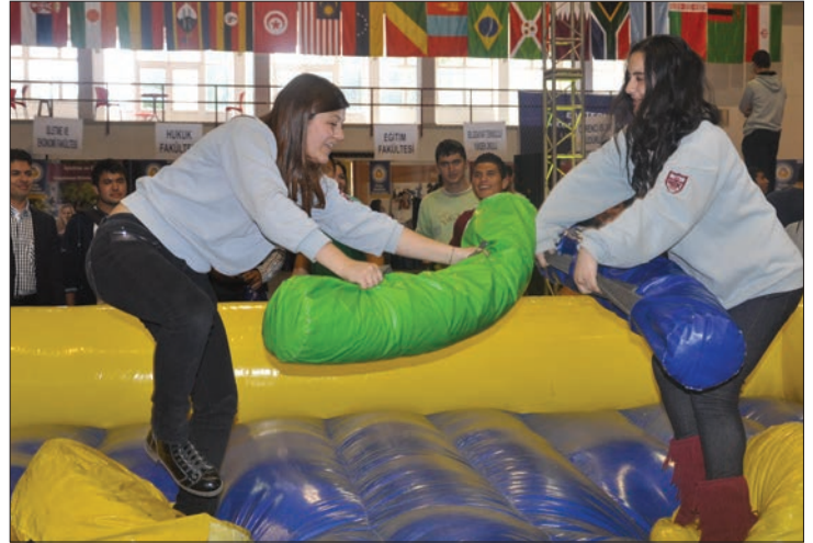
DAÜ 4. Tanıtım Günleri'nde öğrenciler birbirinden eğlenceli oyunlara ve yarışmalara katıldılar