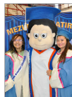
Etkinlik Hakkında Ne Dediler?