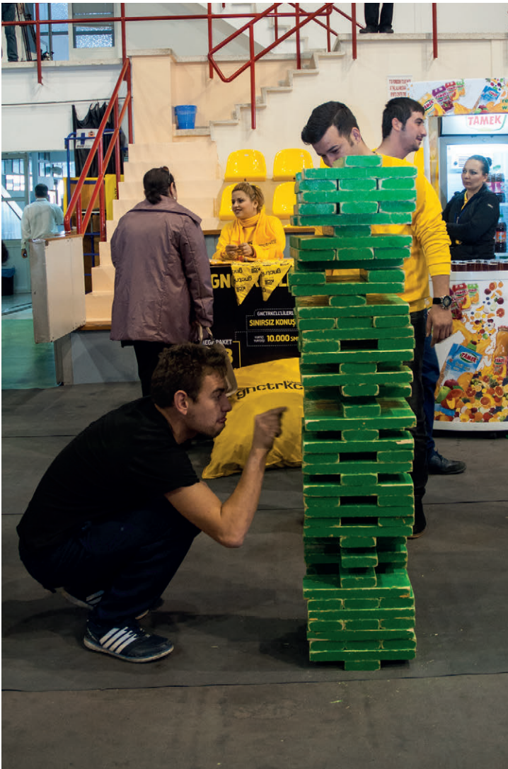
Tanıtım Günleri'nde öğrencilerin keyif alacağı etkinlikler düzenlendi