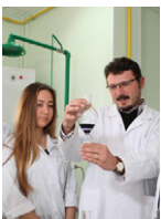
DAÜ Giriş ve Burs Sınavı 2 Haziran'da Yapılıyor