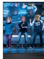
Tanıtım Günleri'nde Öğrenciler Eğlenceli Saatler Geçirdi