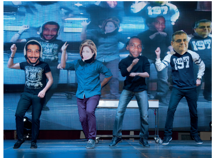
Etkinlikte renkli ve eğlenceli sahne şovları da gerçekleştirildi