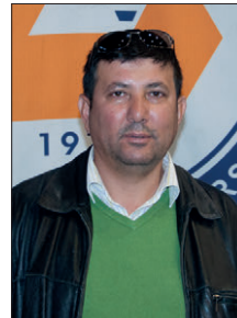
Ali Erden Değirmenlik Lisesi Rehber Öğretmeni

Tanıtım günlerinde öğrencilerimiz bilgi alma fırsatı buluyorlar ve bu öğrencileri daha fazla motive ediyor. Etkinliklerle birlikte tanıtım günleri ilgi çekici oluyor ve öğrenciler bilgi alırken eğleniyorlar. DAÜ çok önemli atılımlar yaptı ve KKTC'nin en iyi üniversitesidir. DAÜ daha emin ve sağlam adımlarla ilerliyor ve bu öğrenci kalitesinin yükselmesini de sağlıyor.