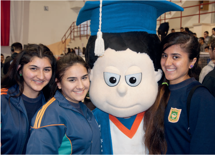
Lise öğrencileri DAÜ maskotu ile hatıra fotoğrafı çektiler

Üç gün boyunca "DAÜ 5. Tanıtım Günleri"ne katılan liseli gençler, akademik bilgi almalarının yanında aktiviteler, gösteriler, müzik ve oyunlar eşliğinde keyifli saatler de geçirdiler.