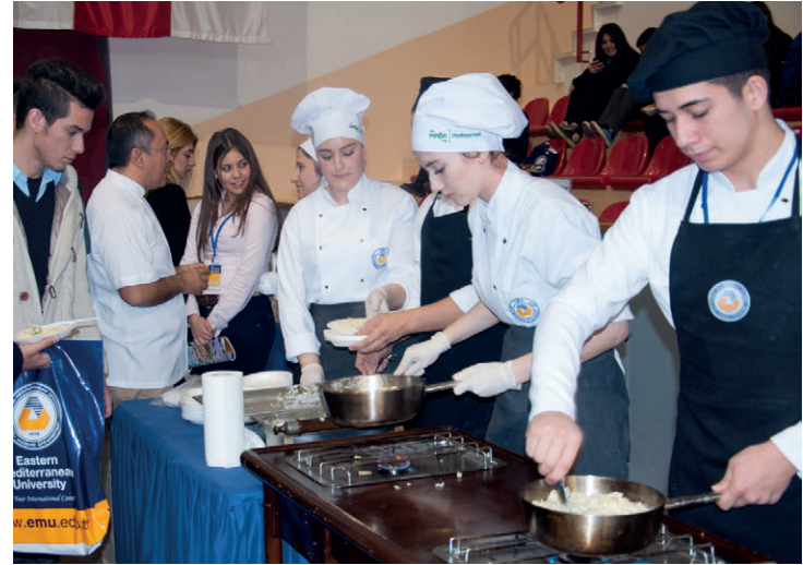
DAÜ Turizm Döner Sermaye Birimi Tanıtım Günleri'nde stand kurarak lezzetli yemekler pişirdi