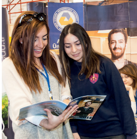
Lise öğrencileri akademik birimler tarafından bilgilendirildiler