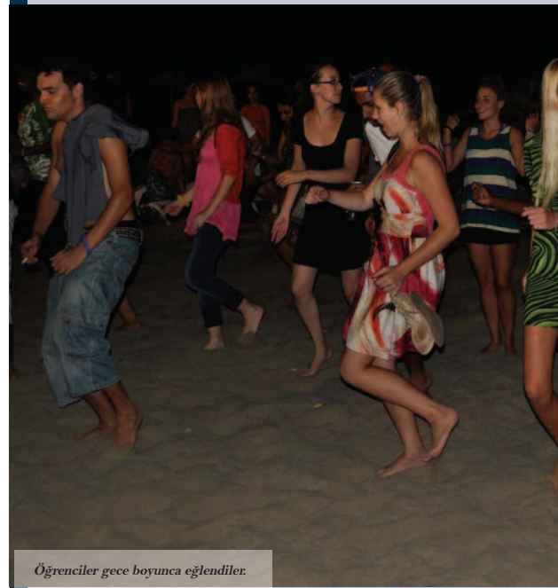
Öğrenciler gece boyunca eğlendiler.

Doğu Akdeniz Üniversitesi (DAÜ) Doğu Akdeniz AIESEC'den gelen 25 farklı ülkeden 116 stajyer öğrenciyi ağırlamaya başladı. "Dünya'nın geleceği için" sloganıyla düzenlenen etkinlikte, öğrenciler deniz Ünlüleri ile tanışma fırsatı buldu.