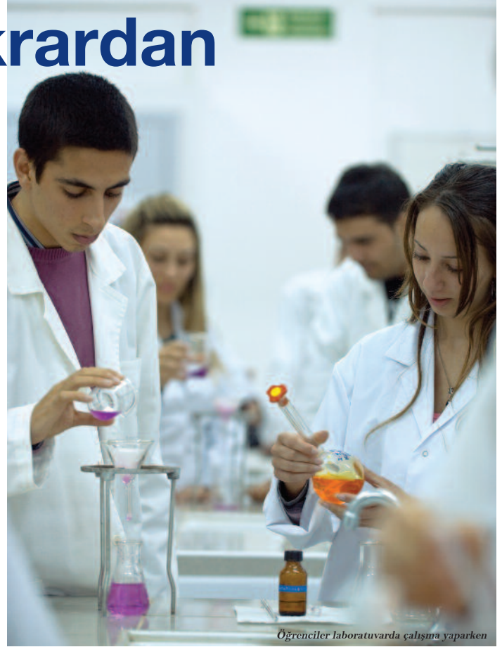
Öğrenciler laboratuvarında çalışmaya yaparken

Tekrardan öğrenci kabulüne başlayacak olan Tıp Fakültesi ile birlikte DAÜ'nün geçen yıl hayata geçirdiği Sağlık Bilimleri Fakültesi ve bu yıl eğitim hayatına başlayan Eczacılık Fakültesi ile DAÜ sağlık alanında bölgenin en güçlü ve yetkili yüksek öğrenim kurumu olarak büyümeye devam ediyor. Uluslararası standartlarda kaliteli eğitime önem vererek akreditasyon ve denklik çalışmalarıyla bölgenin en güçlü Yüksek Eğitim Kurumu olan DAÜ, son iki yıl içinde sağlık alanında eğitime yapmış olduğu yatırımlarla çok farklı alanlarda toplam 10 Fakülte, 4 Yüksek Okul ve İngilizce Hazırlık ve Yabancı Diller Okulu ile güçlü bir Üniversite olarak yoluna devam ediyor.