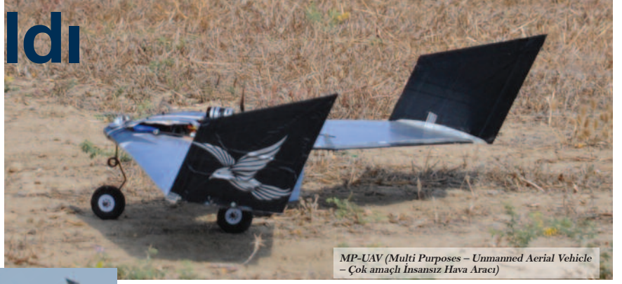
MP-UAV (Multi Purposes – Unmanned Aerial Vehicle – Çok amaçlı İnsansız Hava Aracı)