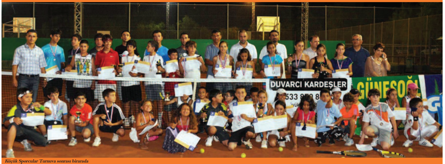
Küçük Sporcular Turnuva sonrası birarada