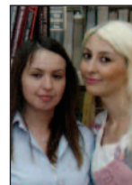
Öğrencilerden Anlamlı Proje: "Ben Okudum Sen de Oku"