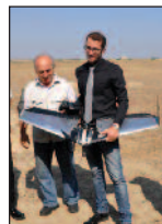
DAÜ Öğrencisinin Bitirme Projesi Olarak Yaptığı İnsansız Uçak Basına Tanıtıldı