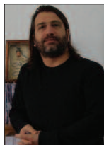
Kıbrıs Uyuşmazlığı ve Barış Müzakereleri Konulu Seminer