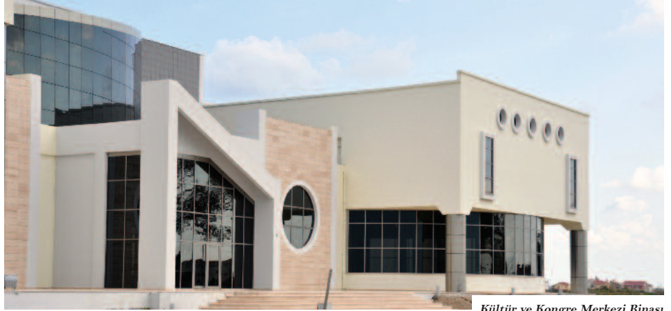
Kültür ve Kongre Merkezi Binası