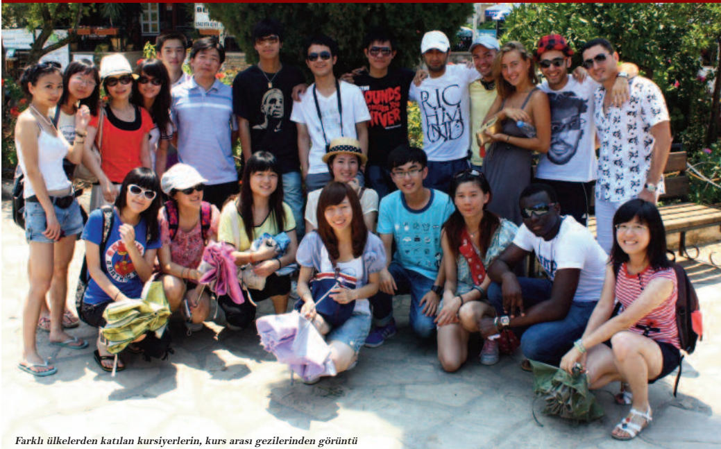
Farklı ülkelerden katılan kursiyerlerin, kurs arası gezilerinden görüntü

Doğu Akdeniz Üniversitesi (DAÜ) Uluslararası İşlerden Sorumlu Rektör Yardımcılığı, DAÜ promosyonları kapsamında uluslararası düzeyde yaz okulu düzenledi. 6 Haziran – 30 Ağustos 2011 tarihleri arasında gerçekleştirilmekte olan Yaz Okulu kapsamında farklı ülkelerden (Azerbaycan, Türkiye, Kazakistan, Çin, Libya, Rusya, İran, Filistin, Türkmenistan, Ukrayna) katılımcıların yer aldığı kısa dönemli İngilizce kursları çerçevesinde 2 haftadan 2 aya kadar farklı zaman dilimlerinde İngilizce öğrenme fırsatı sunuluyor.